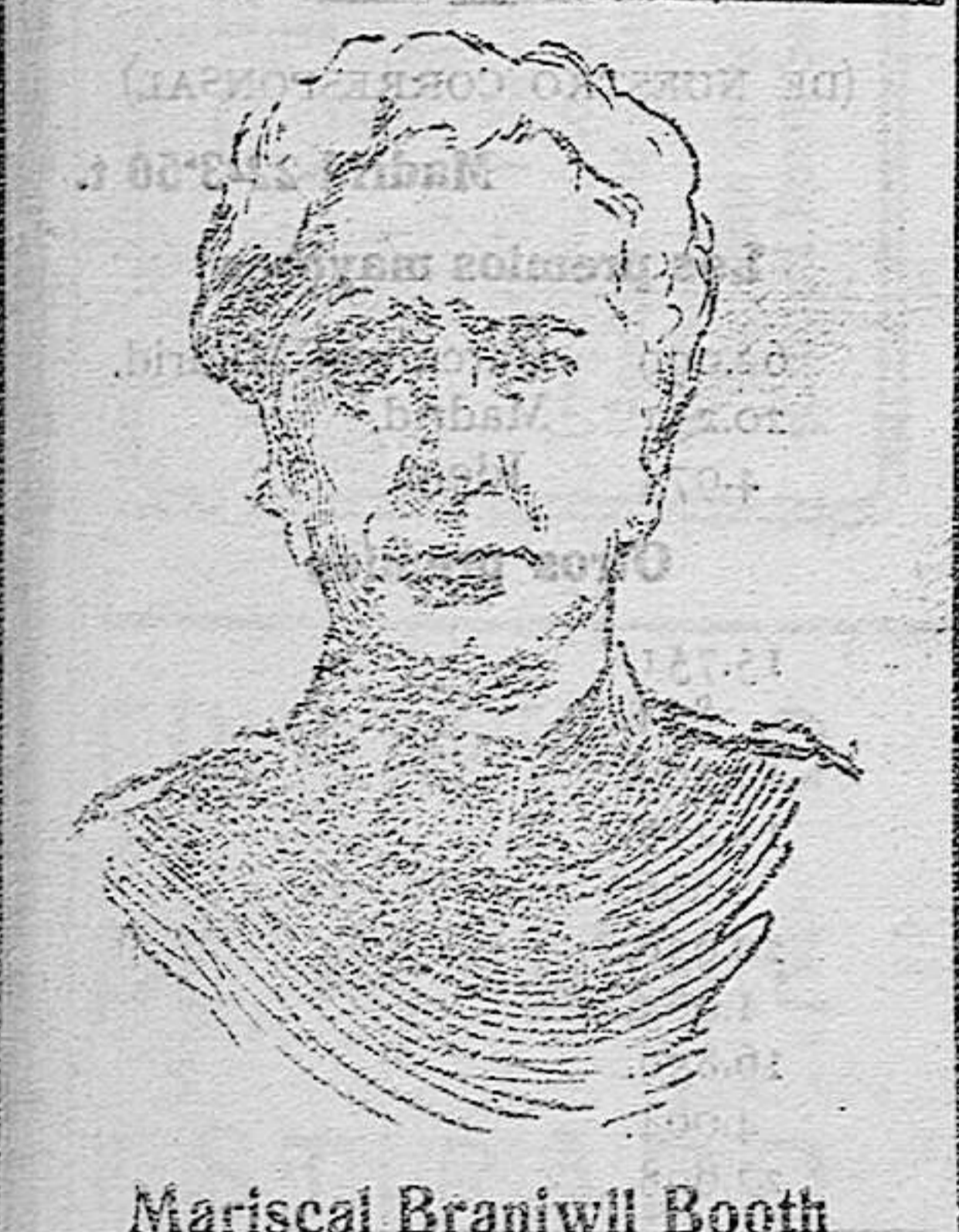
Mariscal Braniwll Booth PRESIDENTE DEL CONGRESO INTERNACIONAL DEL EJERCITO DE SALVACION O DE LA SA-LUD CELEBRADO EN LONDRES.