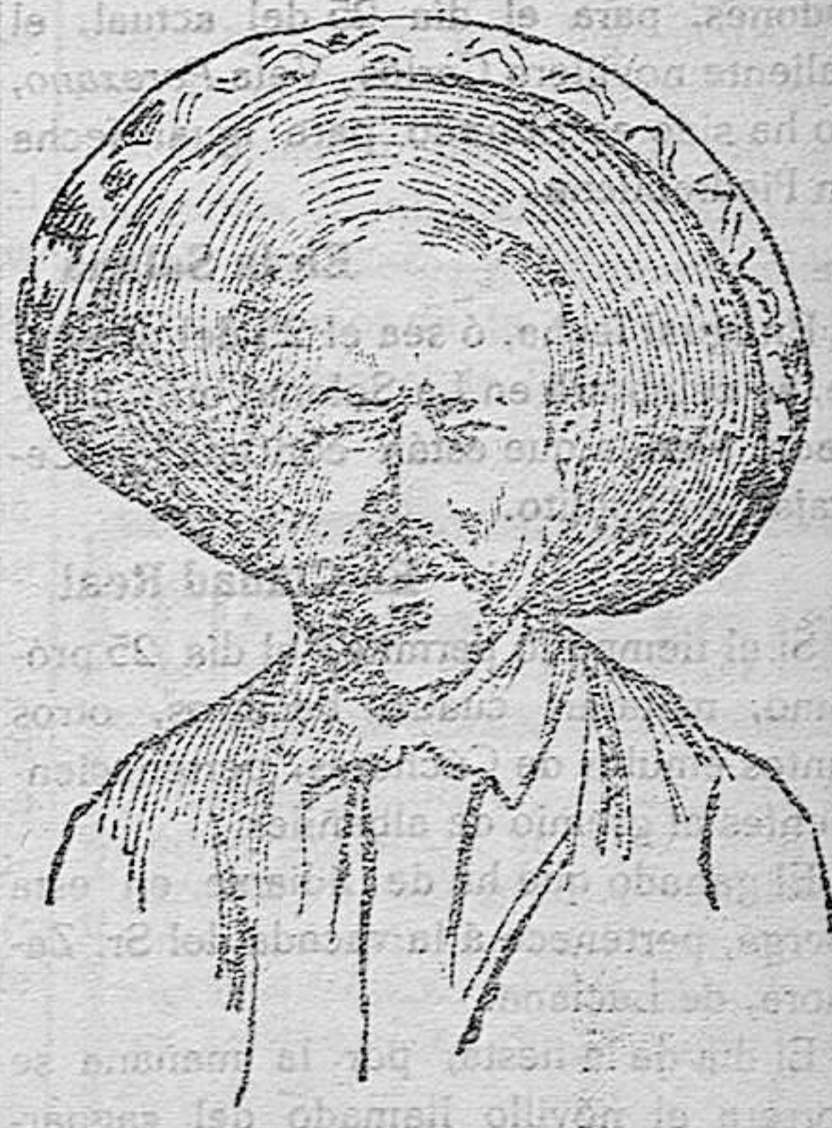
El general Pancho Villa QUE SE HA REBELADO CONTRA LA AUTORIDAD DE CARVAJAL EN EL NORTE DE MEXICO.