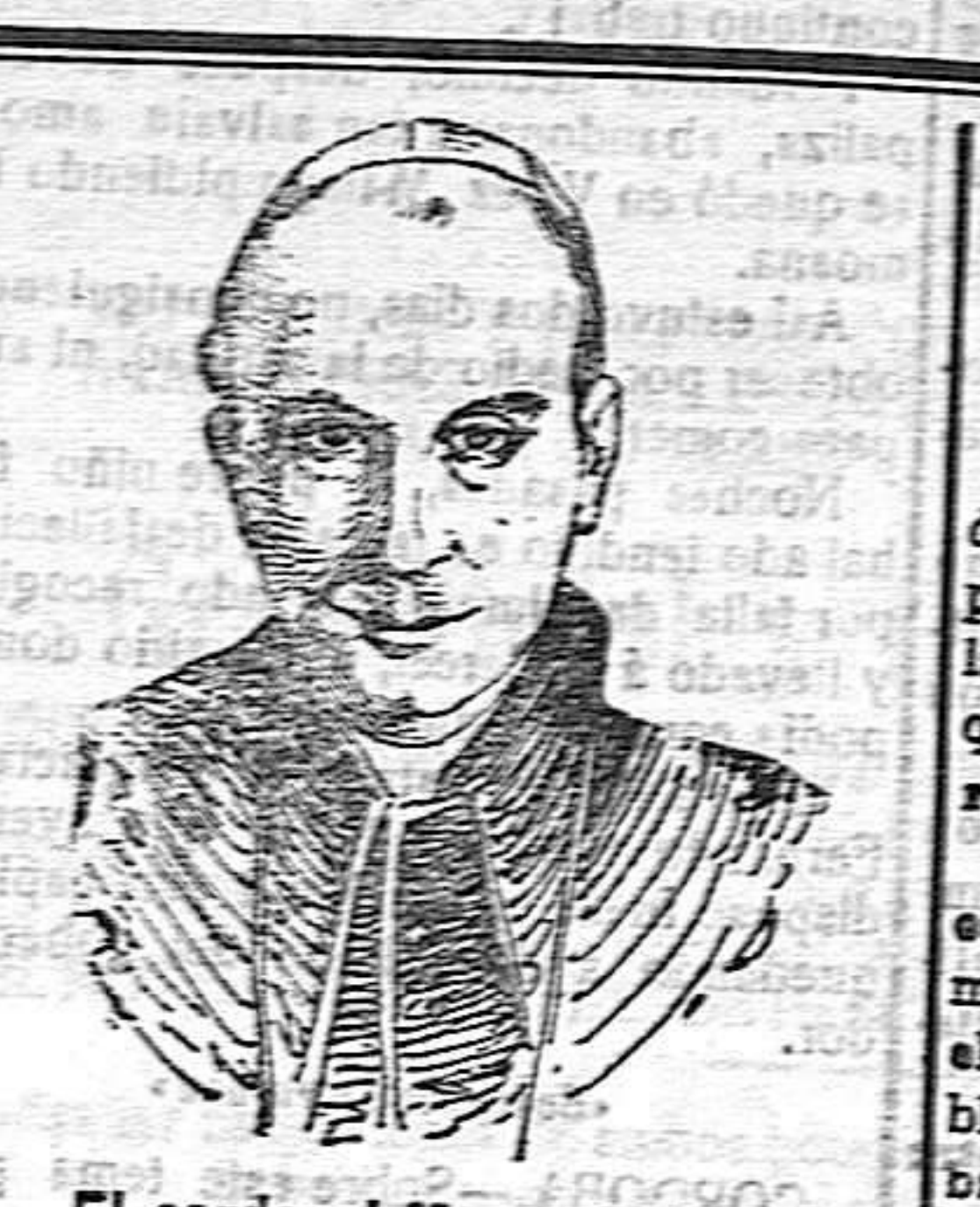
El cardenal Merry del Val

Gracias extraordinarias de Su Santidad para los congregistas. La Santa Sede acaba de bendecir y alentar los entusiasmos y trabajos del Congreso con el notable documento pontificio que insertamos: «Bisatísimo Padre: La Comisión organizadora del Congreso de la Tercera Orden del Padre San Francisco, en Madrid, deseando que las solemnidades dispuestas en honor del Seráfico Patriarca, de cuya venida a España se celebra el séptimo centenario, resulten muy espléndidas, se po-