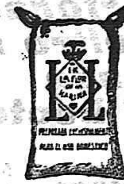
Harina Frappé (1 Kilo)