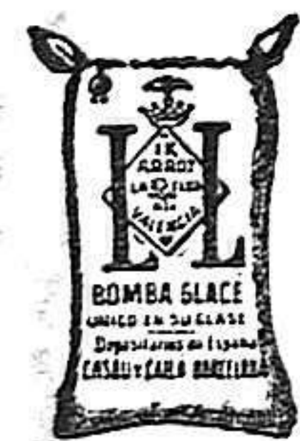
Arroz Glacé (1 Kilo)