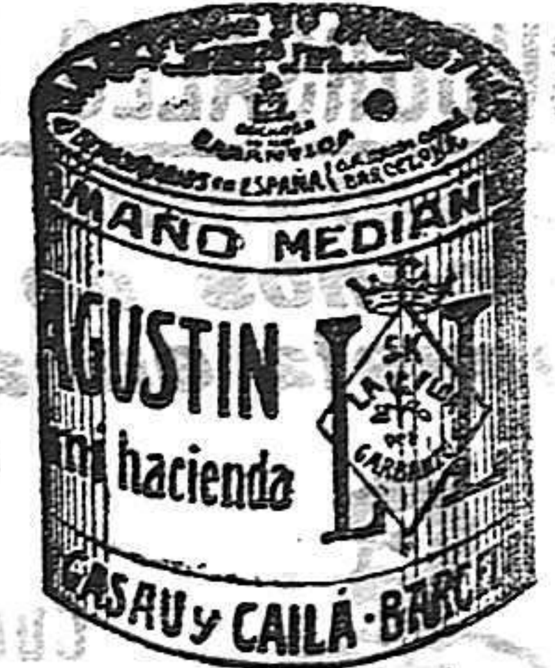
Garbanzo Saucó (5 Kilos)

Garantizamos al público que los comestibles empaquetados con nuestra marca son naturales de la planta, y sin contener la más pequeña adulteración en beneficio de ellos ni para hermostrarlos, por lo cual nos hacemos responsables a todo análisis que quiera efectuarse.