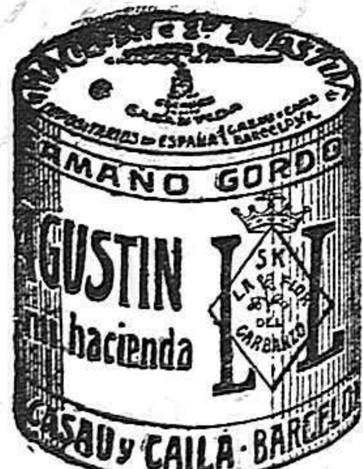
Garbanzo Saucó (5 Kilos)

Las esquelas mortuorias para insertarlas en LA LUCHA se admiten hasta las 3 de la tarde las de la 1.ª página y las de la 2.ª y 3.ª hasta las 5.