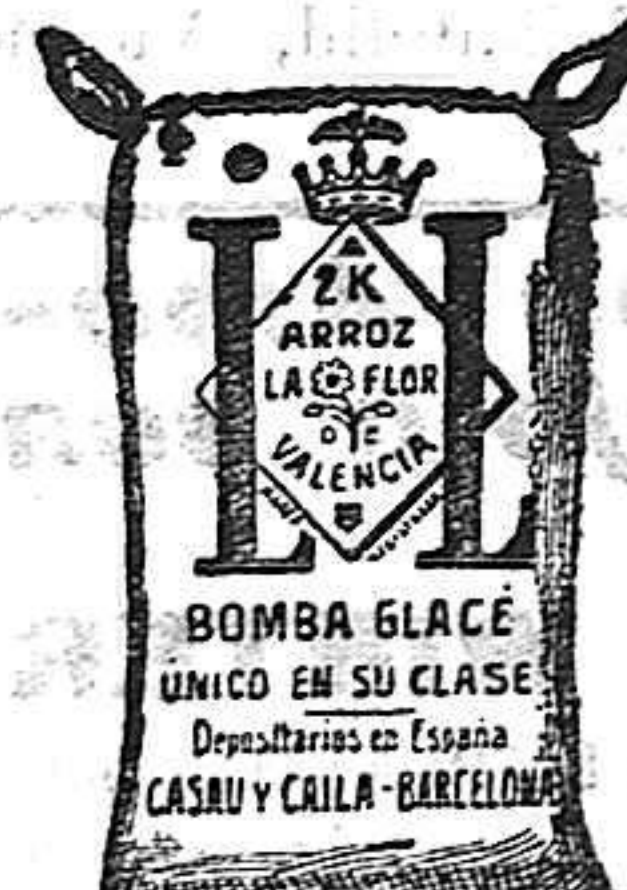
Arroz Glacé (2 Kilos)