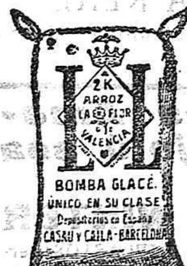
Bomba Glacé (2 Kilos)