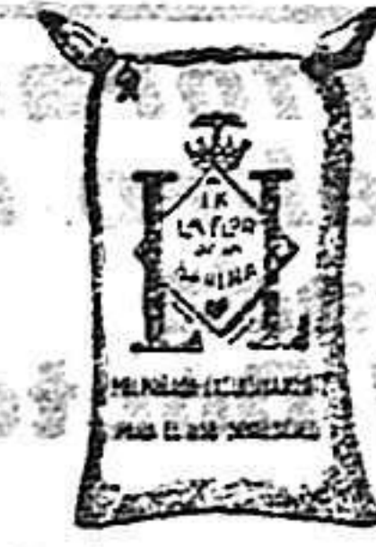
Macina Frappa (1 Kilo)