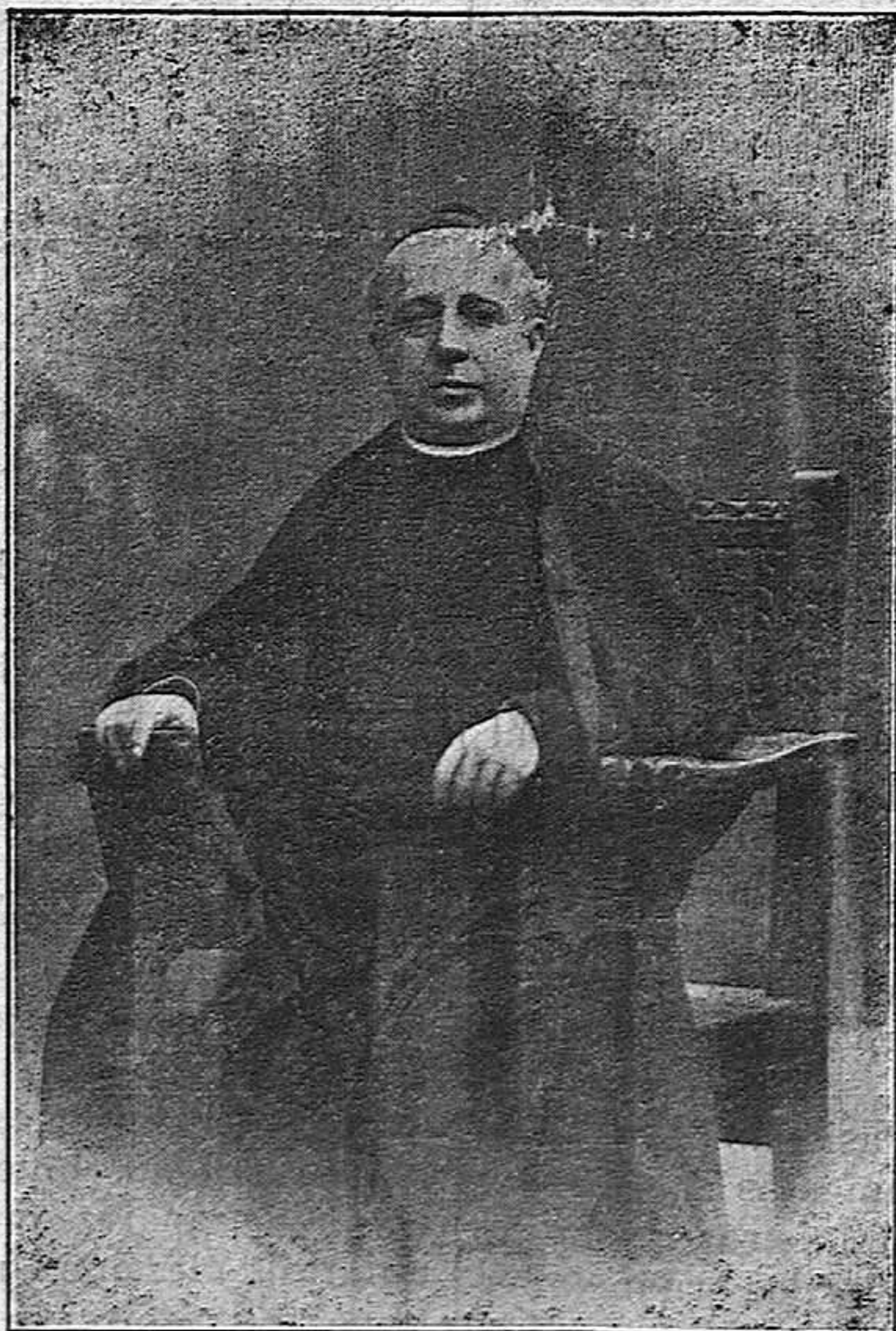
El nuevo Obispo de Gerona

Durante los veinte años que ha sido miembro del Cabildo, se ha conquistado la simpatía y el aprecio de sus compañeros, siendo el ase-