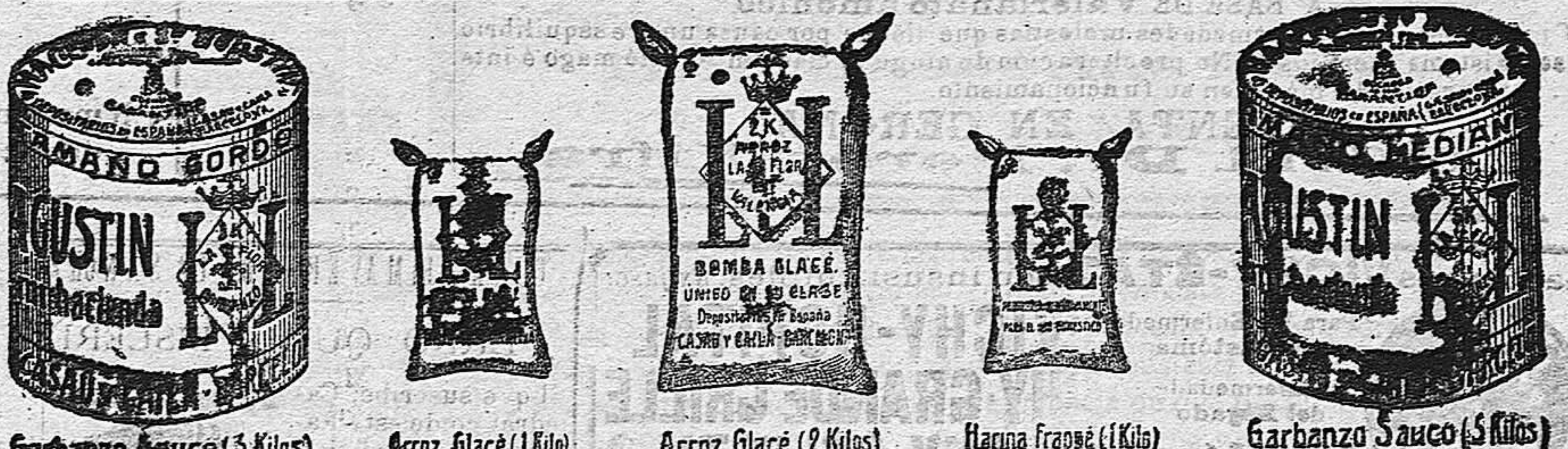
Garbanzo Sauce (3 Kilos) Arroz Glacé (1 kilo) Arroz Glacé (2 Kilos) Harina fragada (1 kilo) Garbanzo Sauce (3 Kilos)

500 páginas + 900 figuras + 600 premios y bono de artículo gran novedad PARTICIPACIÓN EN EL MEDIO BILLETE DE NATIVIDAD N.º 14.228