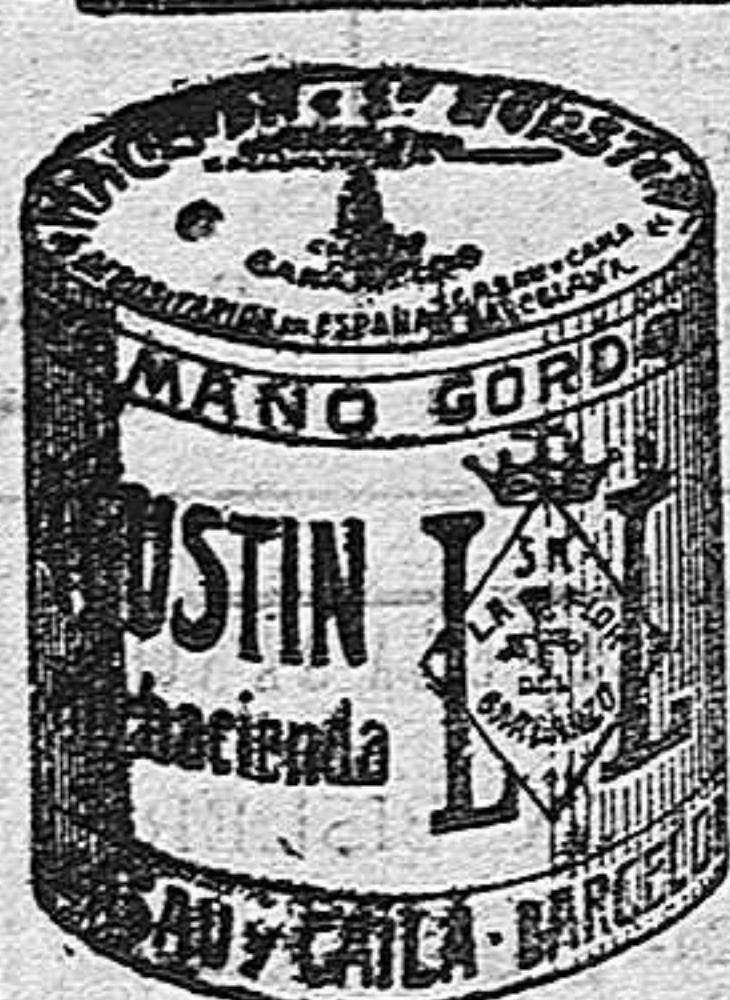
Garbanzo Sauce (5 Kilos)