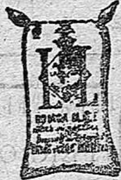
Arroz Glacé (1 Kilo)