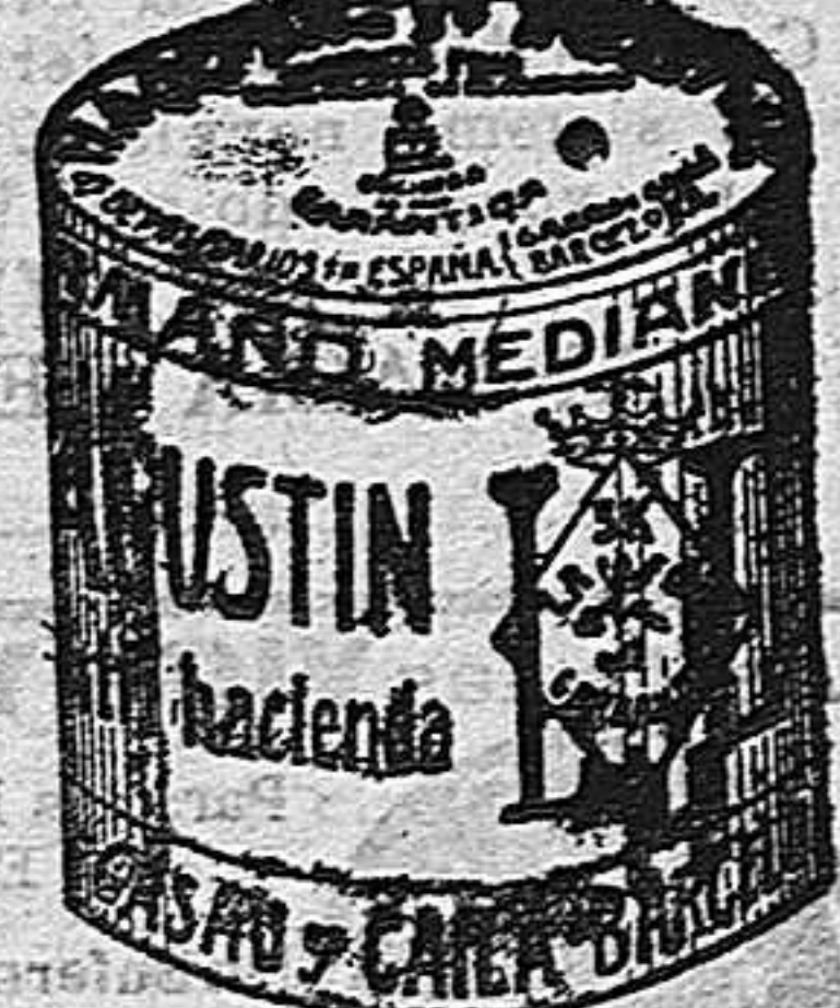
Garbanzo Sauce (5 Kilos)

Garantizamos al público que los comestibles empaquetados con nuestra marca son naturales de la planta, y sin contener la más pequeña adulteración en beneficio de ellos ni para hermosearlos, por lo cual nos hacemos responsables a todo análisis que quiera efectuarse.