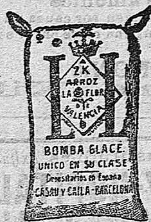
Arroz Glacé (2 Kilos)