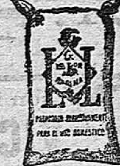
Macina Frappé (1 Kilo)