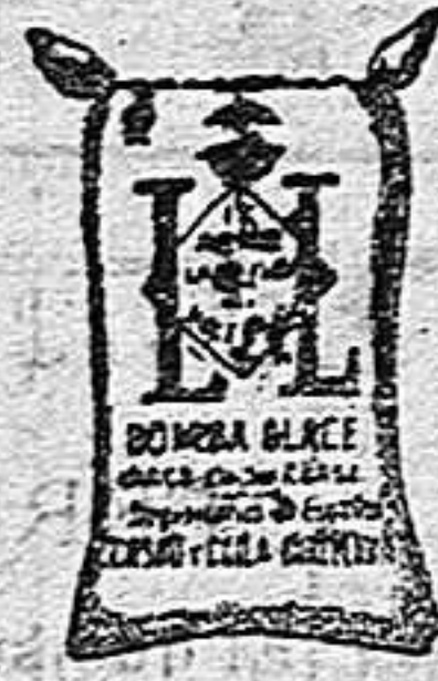
Arroz Glacé (1 kilo)