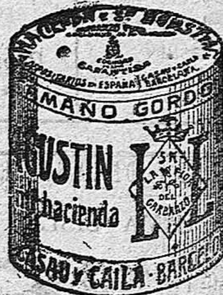
Garbanzo Sauce (3 Kilos)