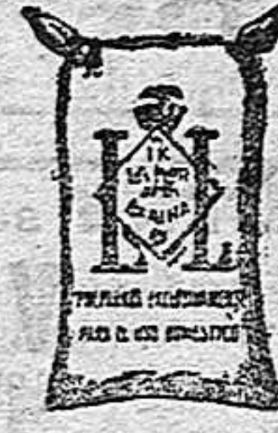
Facina Frappé (1 kilo)