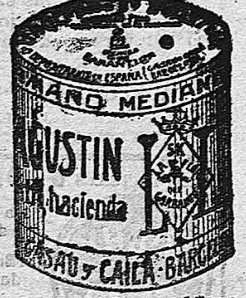
Garbanzo Sauce (5 kilos)

Garantizamos al público que los comestibles empaquetados con nuestra marca son naturales de la planta, y sin contener la más pequeña adulteración en beneficio de ellos ni para hermosearlos, por lo cual nos hacemos responsables á todo análisis que quiera efectuarse.