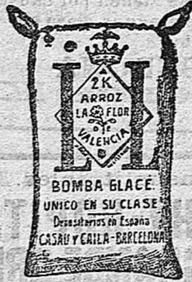
Arroz Glacé (2 kilos)