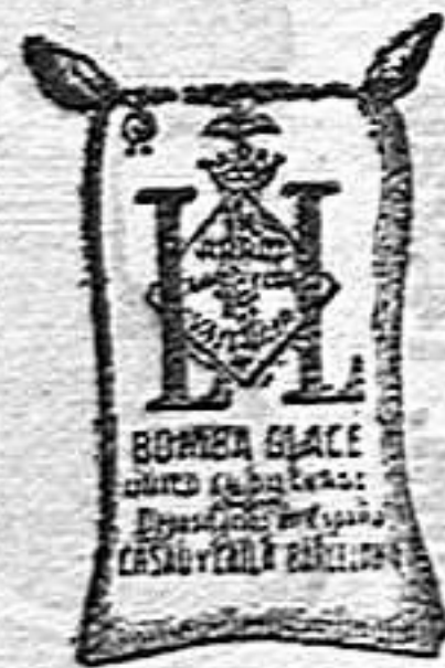
Arroz Glacé (1 Kilo)