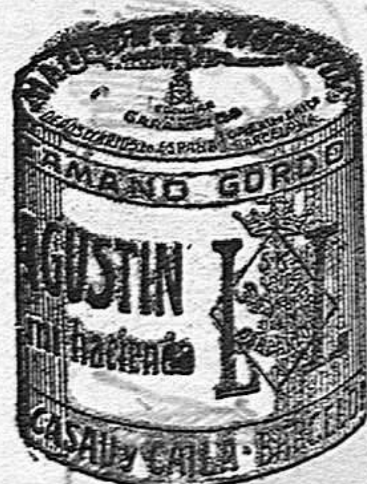
Garbanzo Sauceo (5 Kilos)