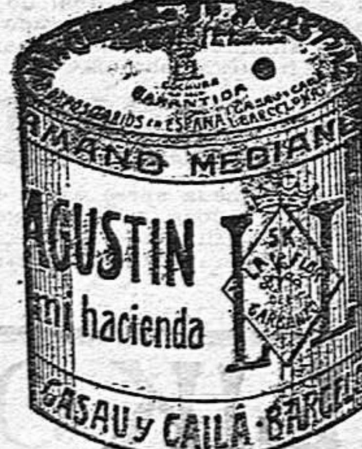
Garbanzo Sauceo (5 Kilos)