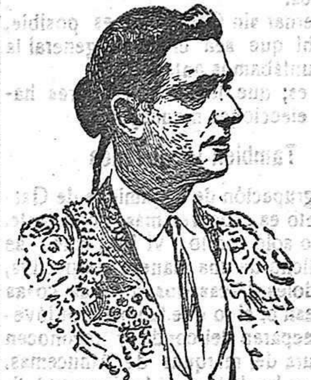
RAFAEL GONZALEZ (MACHAQUITO)

Una tarde del mes de Junio del año 1897 (no recordamos por qué causa) se vio obligado en una plaza de Castilla la Vieja a empuñar los avíos de matar y cumplió con su compromiso, haciéndose aplaudir.