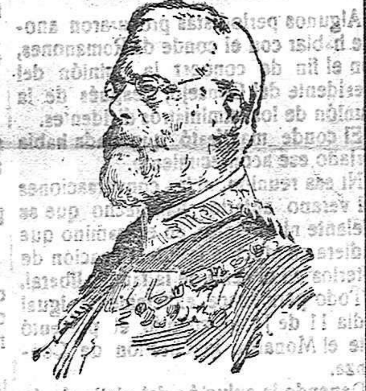
PRÍNPE LUIS, REGENTE DE BAVIERA, ASPIRANTE AL TRONO.