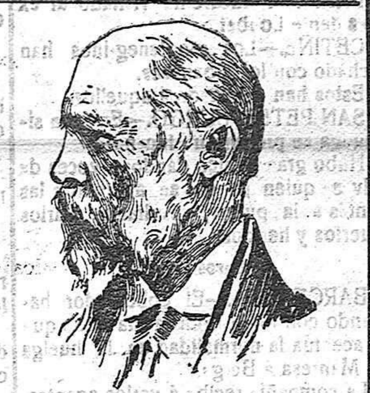
OTHON I, REY DE BAVIERA, A QUIEN SE TRATA DE DESTRONAR.

Este proyecto será objeto de mucho debate, y aun de gran oposición en ambas Cámaras, especialmente en el Senado. La causa de ello es la serie de modificaciones que se han introducido con relación a la primera escuadra. Dícese que una de las modificaciones esenciales en la sustitución del combustible, empleando el petróleo en lugar del carbón. Claro es que en teoría esta modificación sería muy apreciable, pues se aumentaría el radio de acción de los barcos y se disminuiría el peso muerto y el personal de maquinaria. Pero en la práctica existe la dificultad principal del precio del petróleo, que haría ascender a una respetable cantidad el sostenimiento de los nuevos barcos.