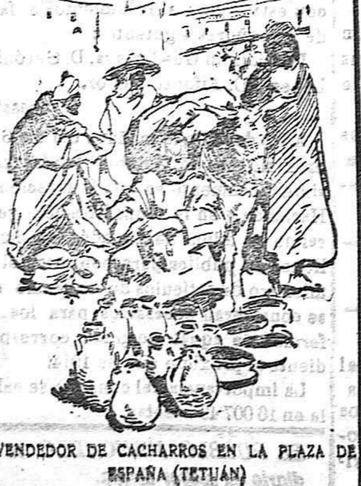
VENDEDOR DE CACHARROS EN LA PLAZA DE ESPAÑA (TETUAN)