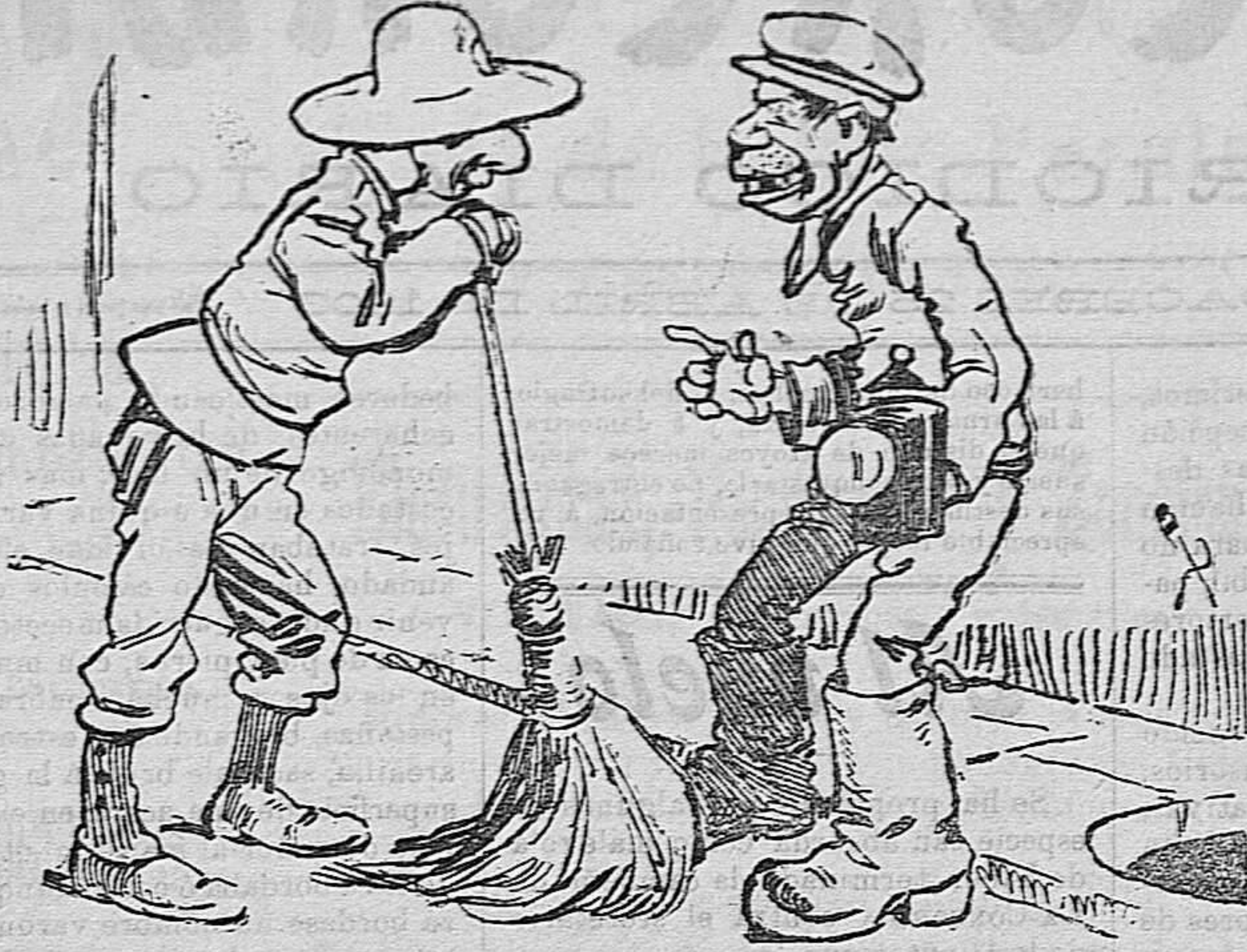
El barrendero.—Chicu, pareces un deputao. —¿Por qué lo dices, Colín? —Porque te pasas la vida recorriendo el distrito.

«En la rada de Cherburgo se nos ha aparecido por la noche, lanzando al cielo los rayos de sus enormes ojos incandescentes, ceñido por una aureola de luz y un nimbo de colores. Brillaban sus 2.700 lámparas eléctricas á través de las porillas y en las cubiertas como escamas de fosforescentes monstruo surgido de las misteriosas grutas oceánicas empedradas de cristal y diamantes.