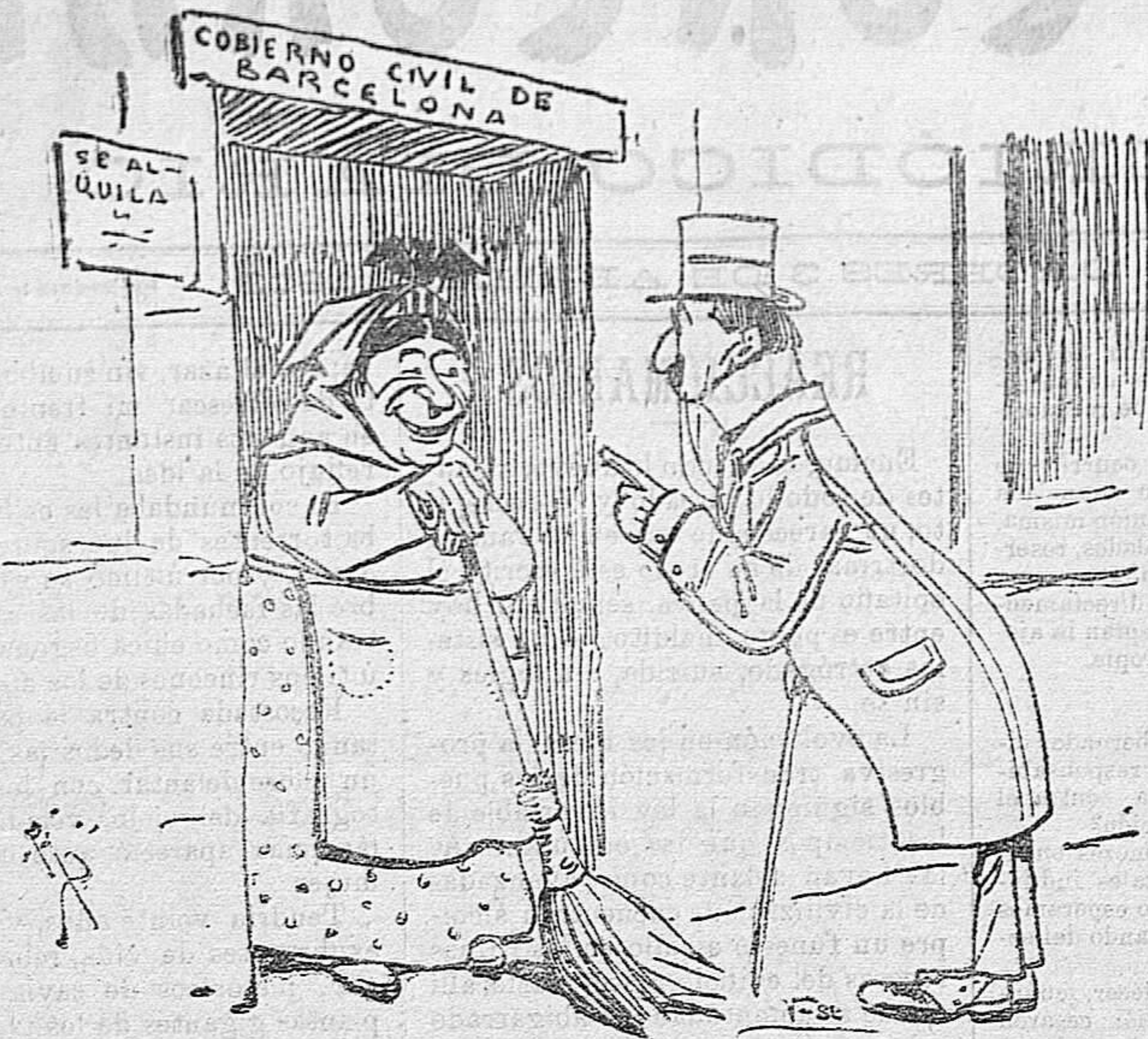
—Diga usted, portera, ¿tiene muchos cuartos esa habitación que se alquila? —Como muchos cuartos, no; pero sí muchos inconvenientes...

berg es un centro de primer orden para la fabricación de toda clase de juguetes.