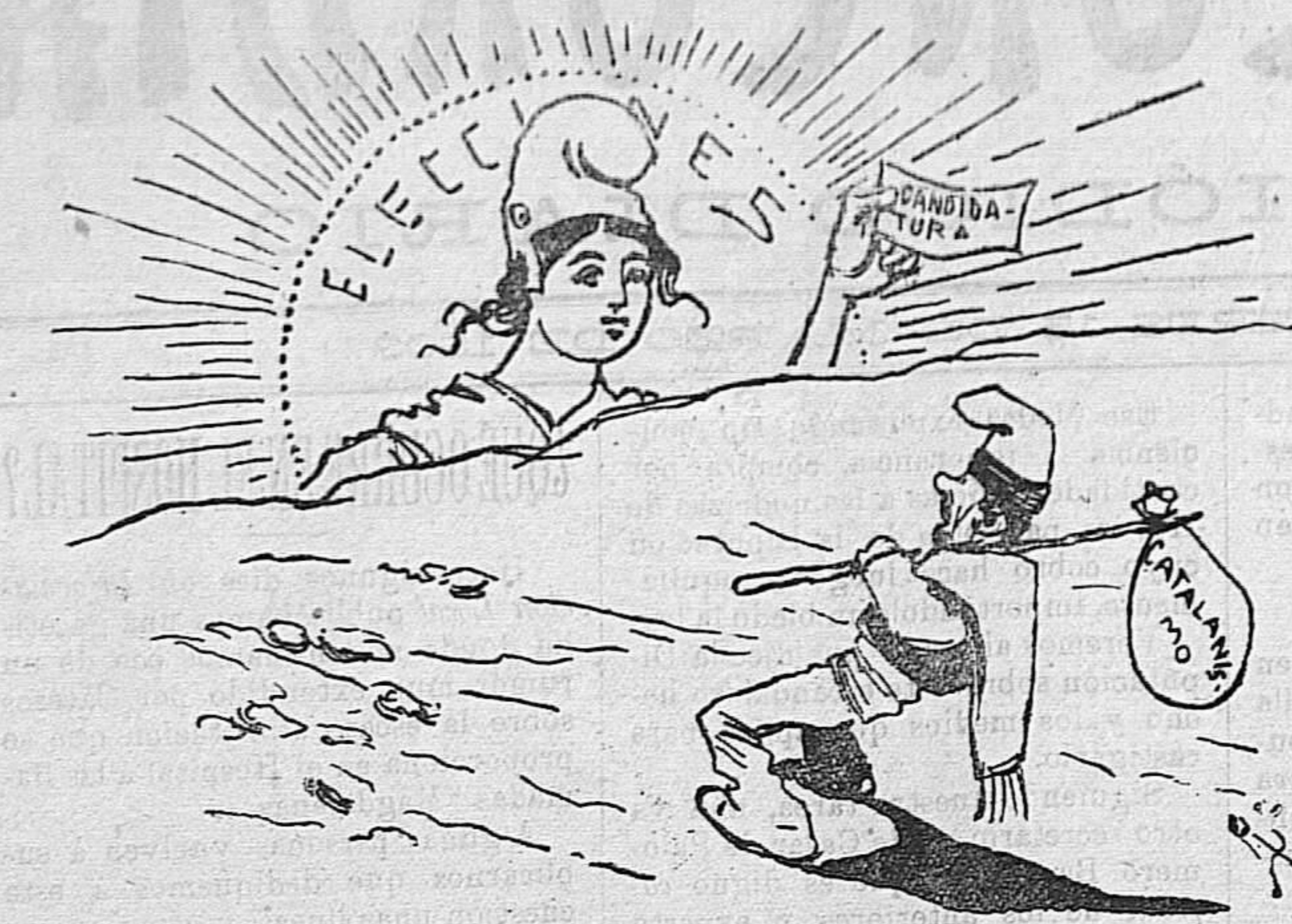
«¡Voto va Den! Eso de que el sol sale para todos igual no es verdad.»

En ocho partes se halla dividida la Historia, que son: los tiempos primitivos, la influencia romana, la dominación visigoda, la musulmana, el restablecimiento de la hegemonía na-