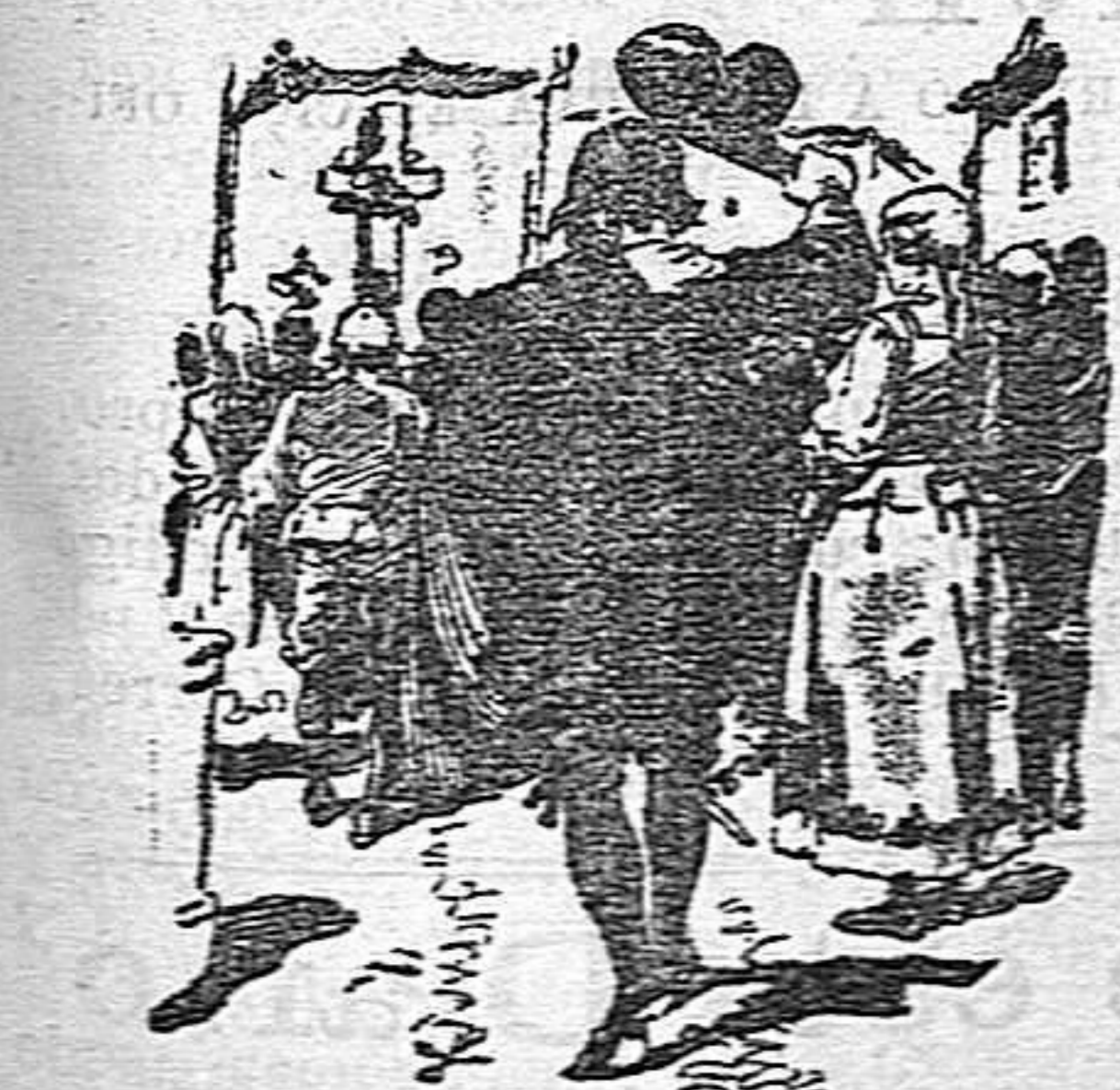
La Invencción de la Santa Cruz es hoy, y todos saben que en tal día se elevan en cada calle cien improvisados altares al sacrosanto

Pero, ¿qué mucho que media docena de días le diera sobrado espacio para el descanso, cuando ya torna á las andadas, y sin curarse de que por no ser día de fiesta y si sólo de misa, tuvo que ocuparse de sus habituales tareas, sálase otra vez de quicio y se desparra por sus estrechas calles y poco regulares plazuelas, buscando en las emociones de la alegría algo que distraiga el tedio de sus vicios?