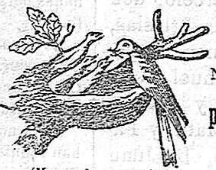
(Marca de garantía.)