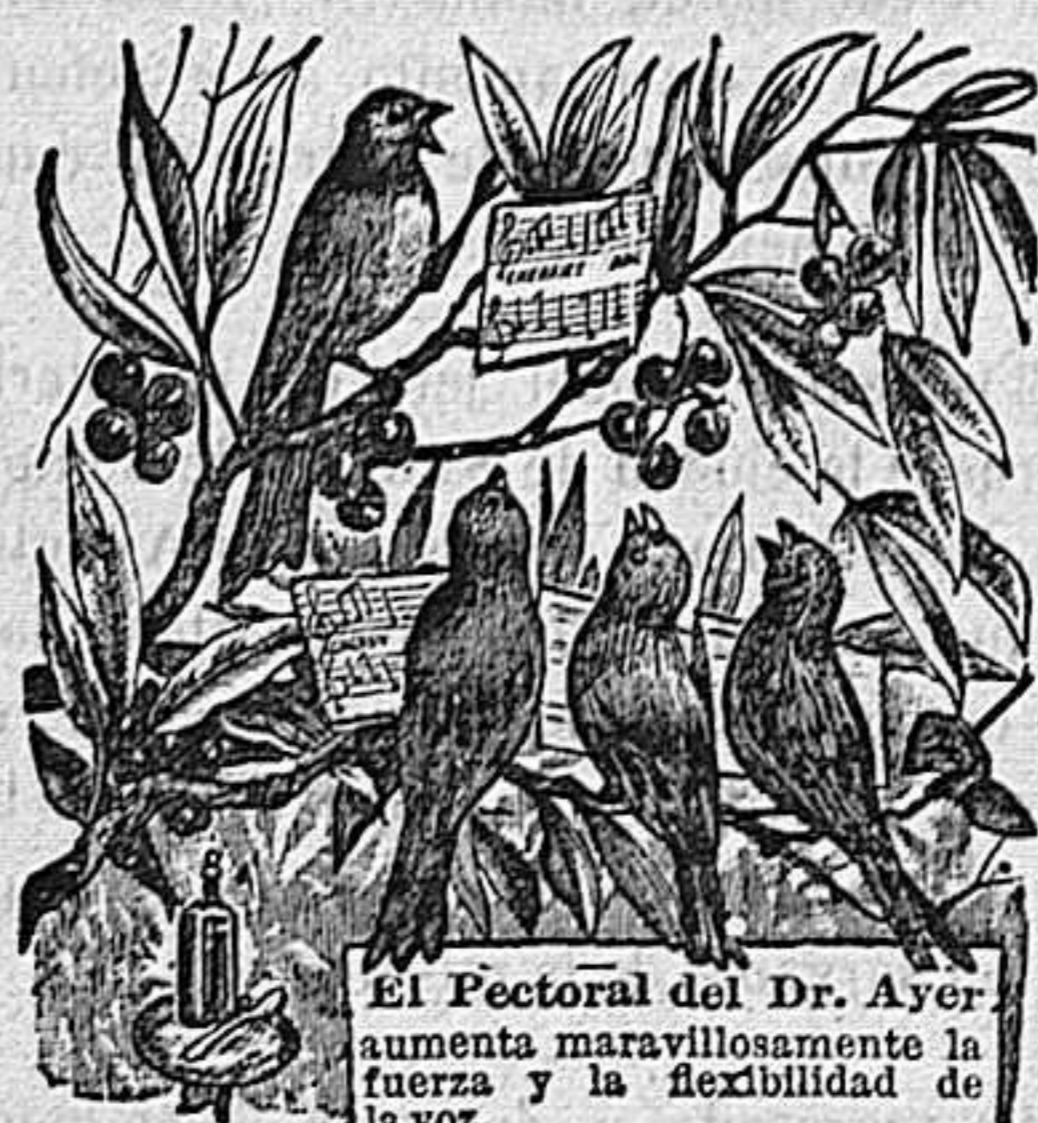
El Pectoral del Dr. Ayer aumenta maravillosamente la fuerza y la flexibilidad de la voz.