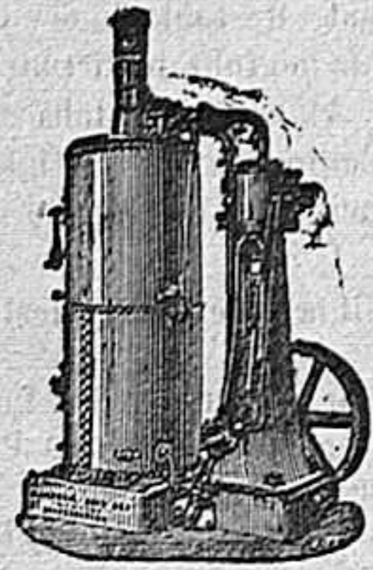
Máquina de vapor vertical.