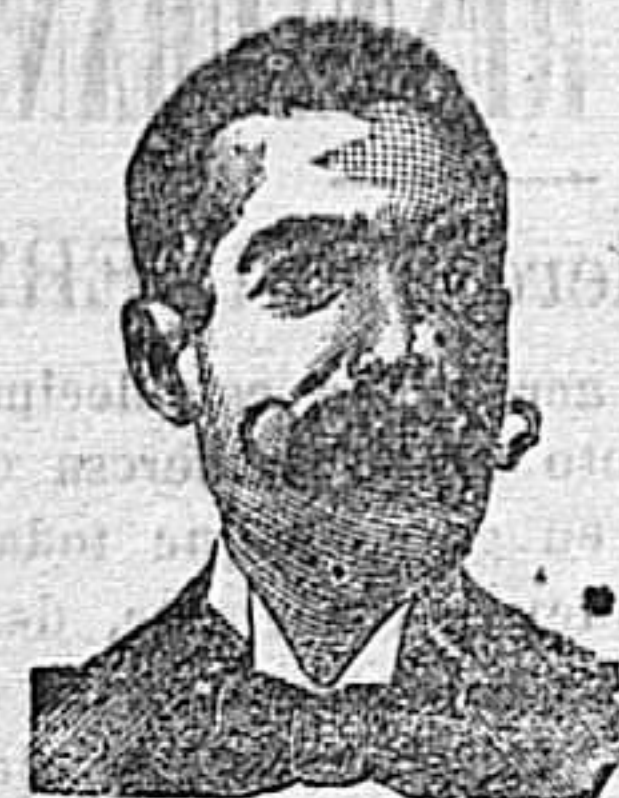
A. Sarrati Costanzi Diputación, 435, Barcelona