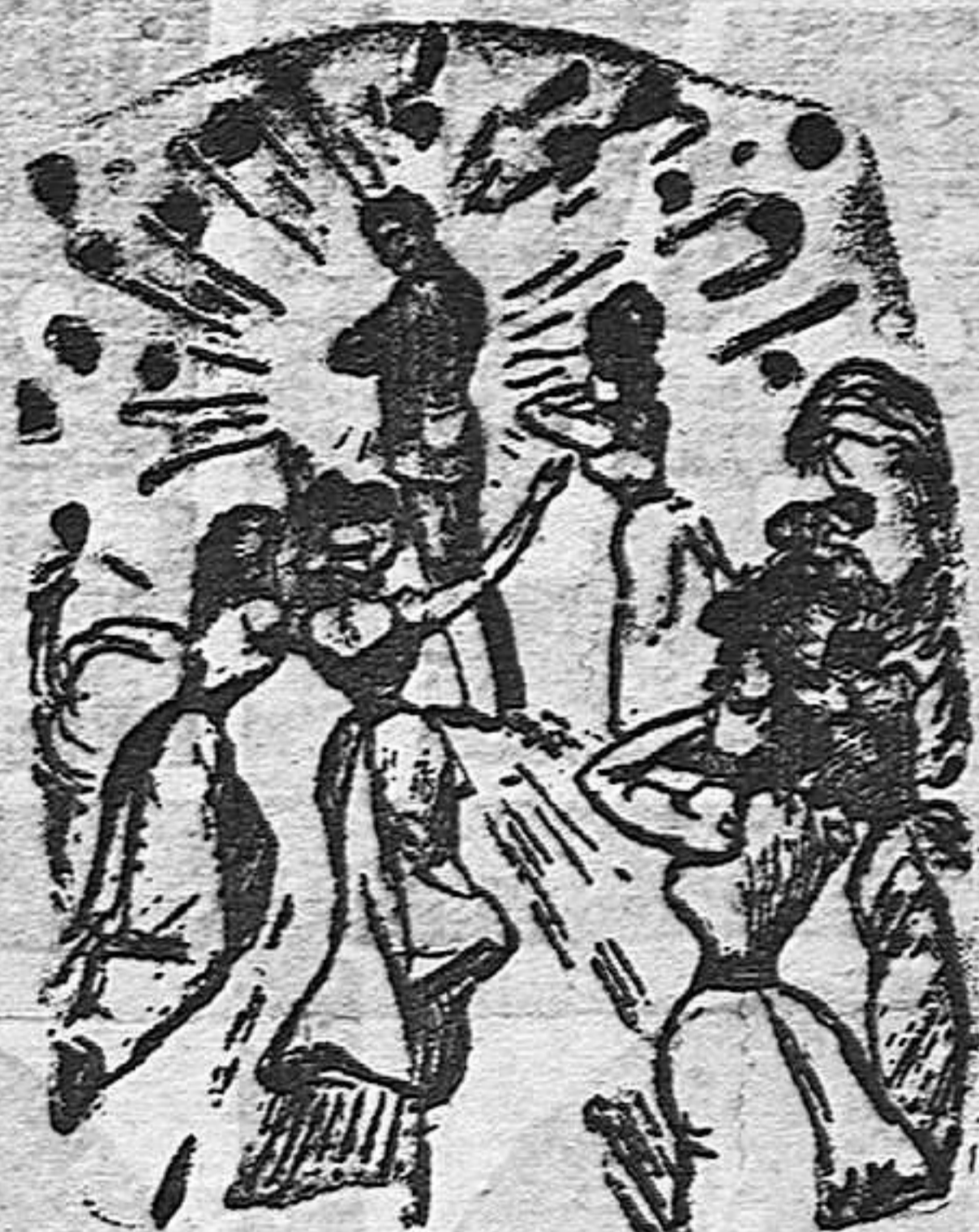
SISENANDO en las orillas del Nilo

Fué el caso, que dos días antes de celebrarse la boda entre la bella japonesa y el gentil esquimal, recibió éste una orden de su señor el Shak de Persia, para que inmediatamente tomara el mando de la flotilla de submarinos marítimos y fuera á dar caza á una terrible foca que hacía algún tiempo traía aterrORIZADOS á los pacíficos habitantes de las riberas del Nilo.