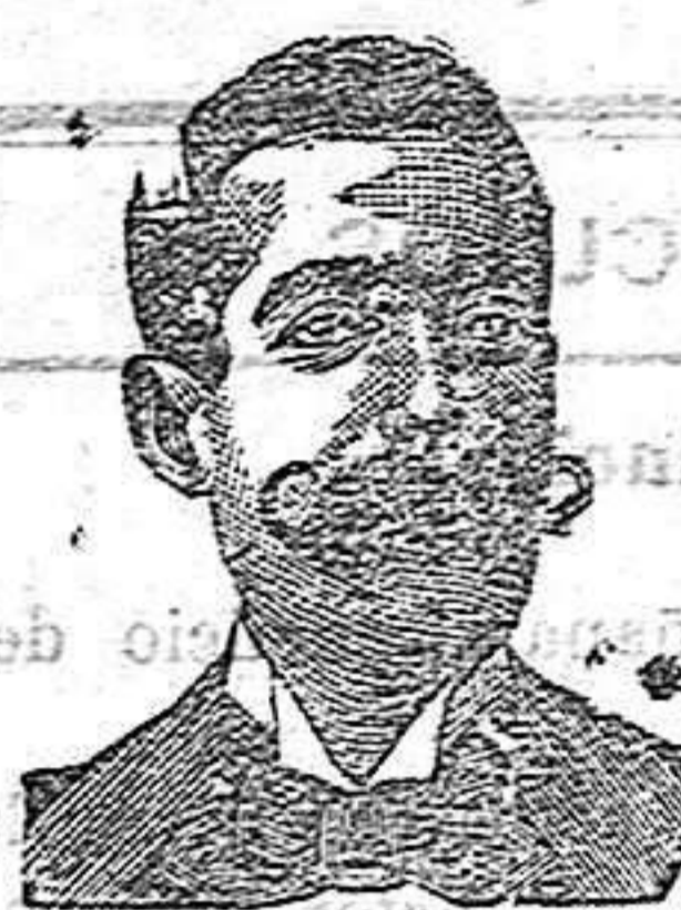
A. Salvati Costanzi Diputació, 435, Barcelona