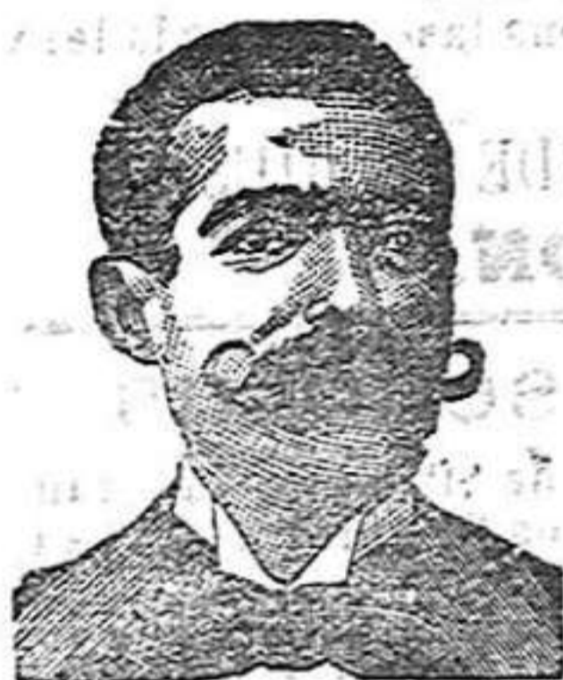
A. Salvati Costanzi Diputación, 435, Barcelona

ESQUELAS Se reciben en la imprenta de este periódico hasta la una de la mañana.