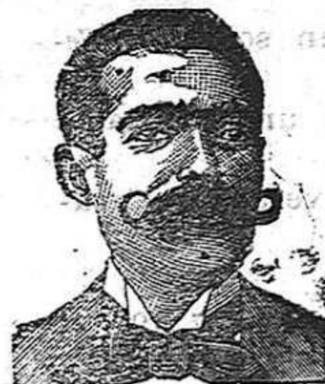
A. Salvati Costanzi Diputación, 435, Barcelona

ESQUELAS Se reciben en la imprenta de este periódico hasta la una de la madrugada.