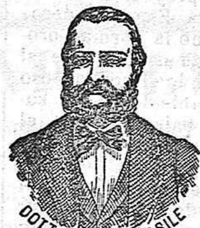
DOCT. NICOLA CASILE Inventor de los renombrados medicamentos CASILE.

han logrado que el Dr. Casile de Nápoles descubriera los milagrosos medicamentos que curan infaliblemente la tisis en cualquiera de sus periodos y todas las enfermedades del estómago. A la más pequeña manifestación de un resfriado, tos, catarro, bronquitis, gripe, asma (sufocación), espectoración y de cualquier enfermedad del pecho, tomar inmediatamente las PERLAS CASILE, que no sólo curan infaliblemente estas enfermedades, sino que se tendrá la completa seguridad de no contraer otras mucho más graves. Siguiendo este método se podrá decir no más tisis.