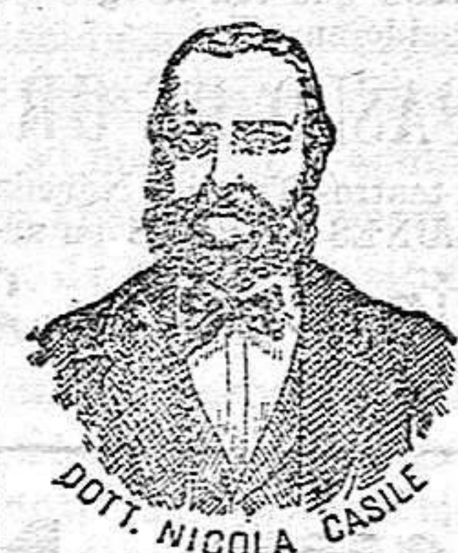
Dr. NICOLA CASILE Inventor de los renombrados medicamentos CASILE.

han logrado que el Dr. Casile de Nápoles descubriera los milagrosos medicamentos que curan infaliblemente la tisis en cualquiera de sus periodos y todas las enfermedades del estómago. A la más pequeña manifestación de un resfriado, tos, catarro, bronquitis, gripe, asma (sufocación), expectoración y de cualquier enfermedad del pecho, tomar inmediatamente las PERLAS CASILE, que no sólo curan infaliblemente estas enfermedades, sino que se tendrá la completa seguridad de no contraer otras mucho más graves. Siguiendo este método se podrá decir no más tisis.