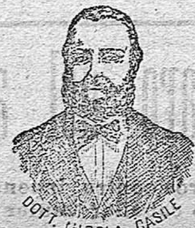
Inventor de los renombrados medicamentos CASILE. Diputación, 435 BARCELONA

han logrado que el Dr. Casile de Nápoles descubriera los milagrosos medicamentos que curan infaliblemente la tisis en cualquiera de sus periodos y todas las enfermedades del estómago. A la más pequeña manifestación de un resfriado, tos, catarro, bronquitis, gripe, asma (sofofación), espectoración y de cualquier enfermedad del pecho, tomar inmediatamente las PERLAS CASILE, que no sólo curan infaliblemente estas enfermedades, sino que se tendrá la completa seguridad de no contraer otras mucho más graves. Siguiendo este método se podrá decir no mas tisis.