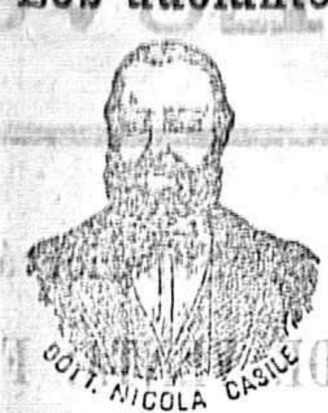
Dr. Casile inventor de los renombrados medicamentos CASILE.

han logrado que el Dr. Casile de Nápoles descubriera los milagrosos medicamentos que curan infaliblemente la tisis en cualquiera de sus periodos y todas las enfermedades del estómago. A la más pequeña manifestación de un resfriado, tos, catarro, bronquitis, gripe, asma (sufocación), espectoración y de cualquier enfermedad del pecho, tomar inmediatamente las PERLAS CASILE, que no sólo curan infaliblemente estas enfermedades, sino que se tendrá la completa seguridad de no contraer otras mucho más graves. Siguiendo este método se podrá decir no más tisis.