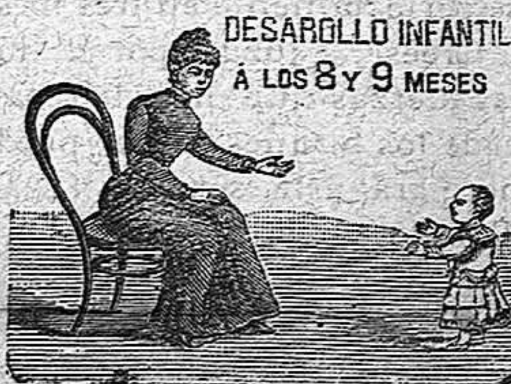
DESARROLLO INFANTIL A LOS 8 Y 9 MESES

Calle de la Universidad, 35 y 37 BARCELONA