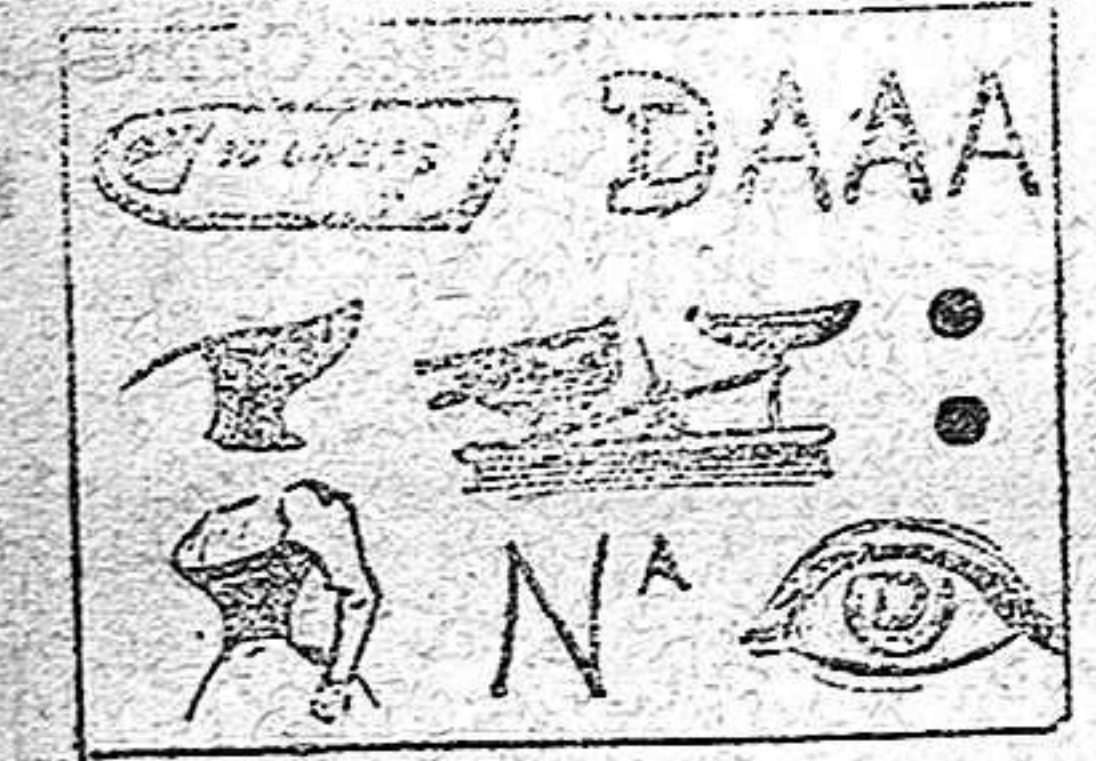
La solución en el próximo número.

Solución á la Charada en acción anterior