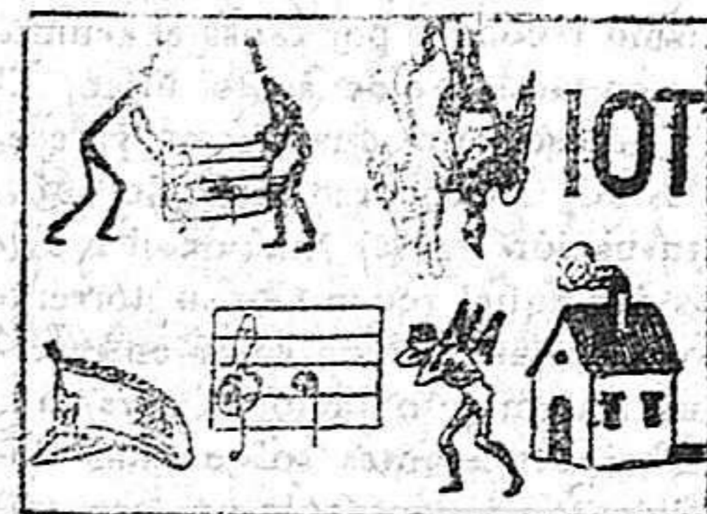
La solución en el próximo número.

Solución á la Frase hecha anterior CANTARSE POR TODO LO ALTO.