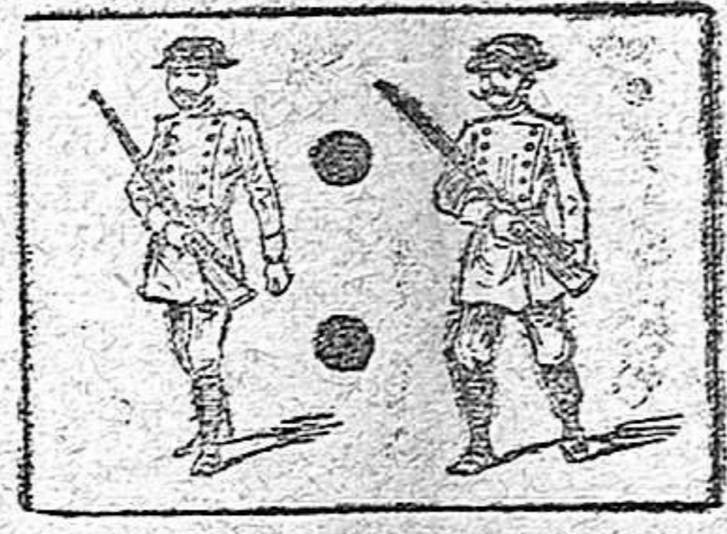
La solución en el próximo número.

Solución á la Charada en acción anterior ESTÚPIDOS.