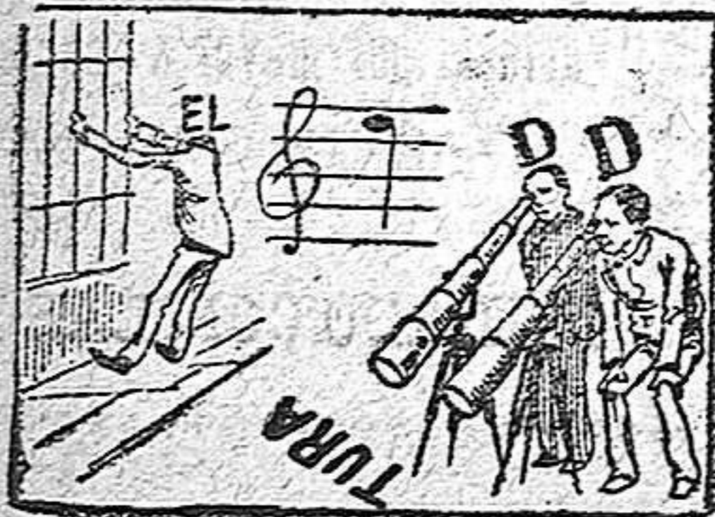
La solución en el próximo número.