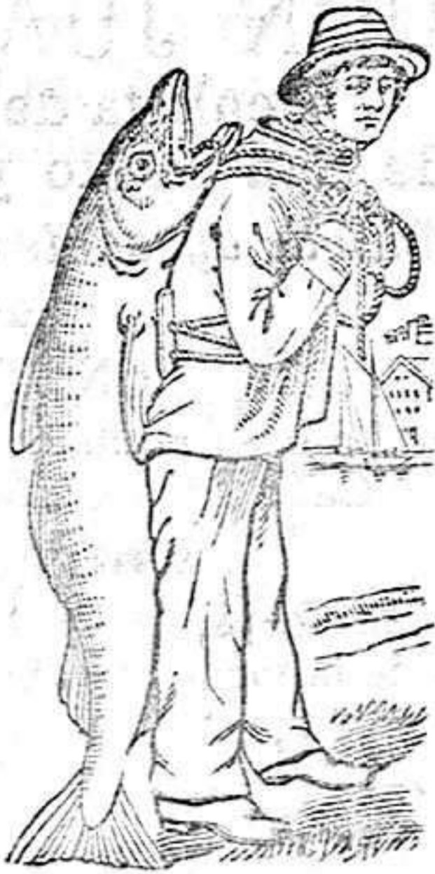
MARKA DE FABRICA

Es de suma importancia que el público pida siempre la legítima Emulsión Scott, la que se conoce por la marca de fábrica (en el envoltorio exterior de cada frasco) representando un hombre que lleva á cuestas un gran bacalao.