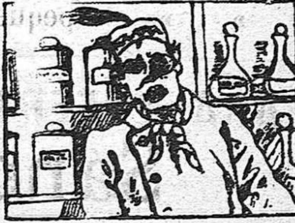
(La solución en el número próximo).