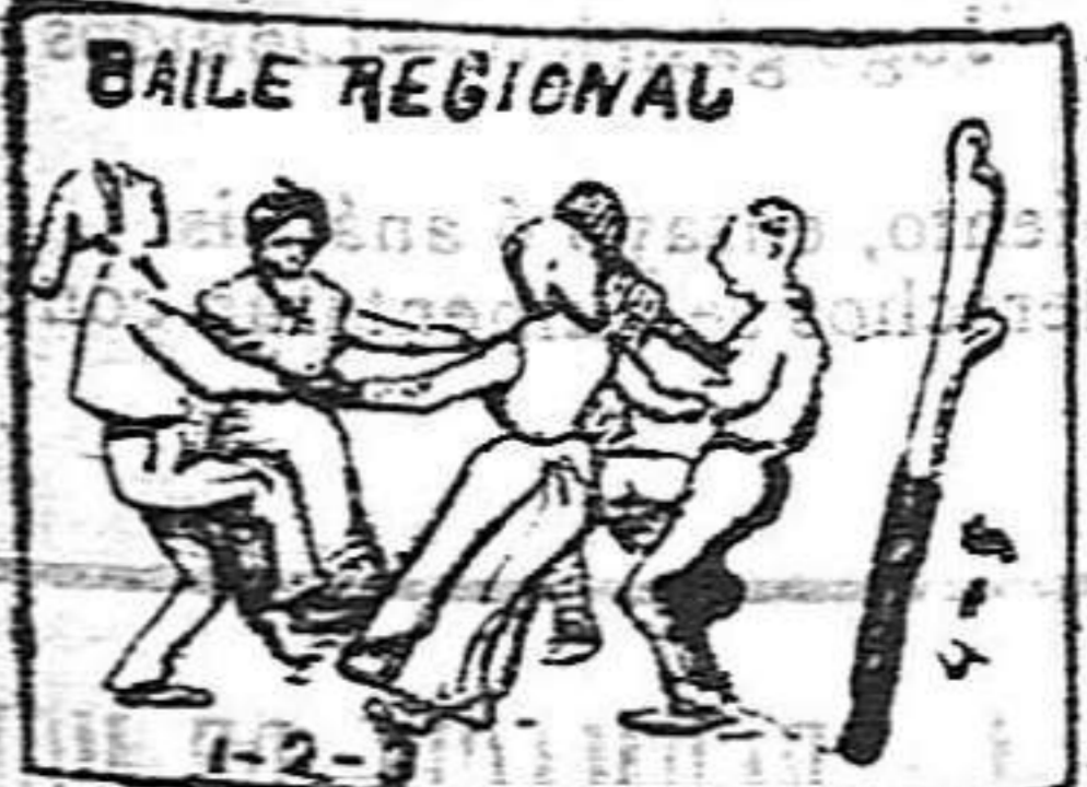
(La solución en el número próximo).

Solución al Jeroglífico anterior En varios puntos hay cólera.