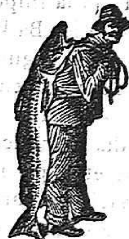
Obtenese siempre la Emulsión con esta marca "El Pescador", marca del procedimiento SCOTT