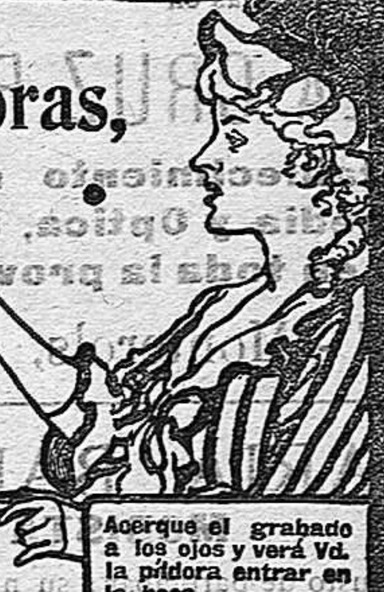
Assegure el grabado a los ojos y verá Vd. la píldora entrar en la boca.

DE VENTA EN LAS BOTICAS DEL MUNDO ENTERO.