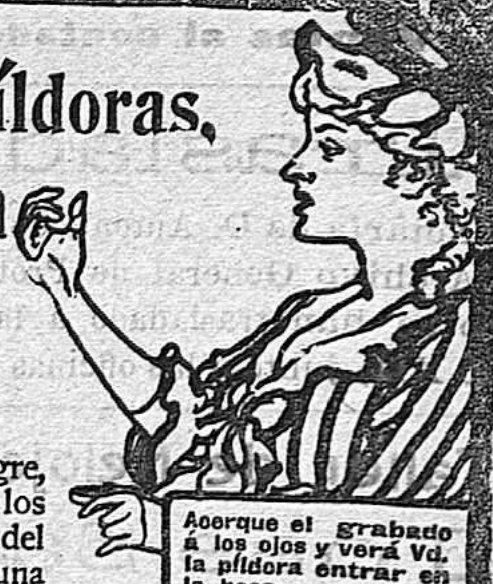
Acorde el grabado à los ojos y verá Vd. la píldora entrar en la boca.

DE VENTA EN LAS BOTICAS DEL MUNDO ENTERO.