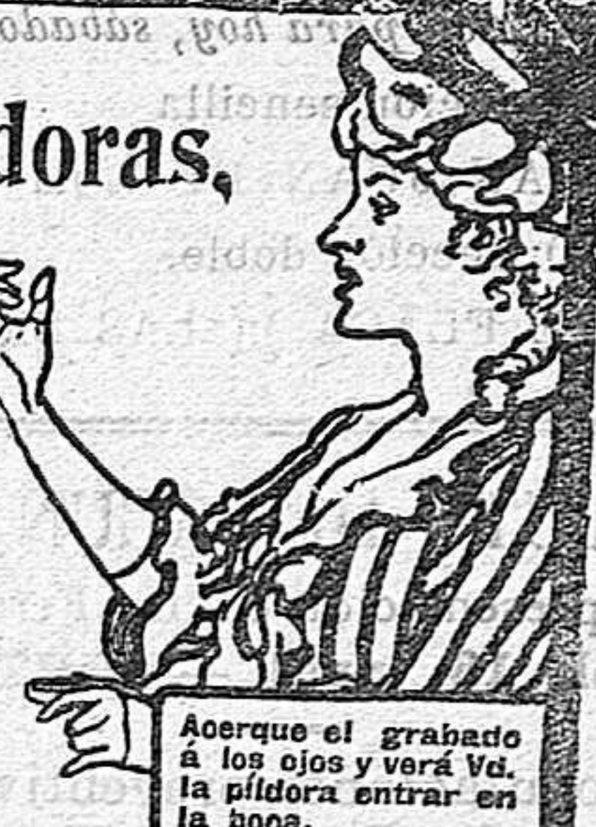
Aoerque el grabado à los ojos y verá Vd. la píldora entrar en la boca.

DE VENTA EN LAS BOTICAS DEL MUNDO ENTERO.