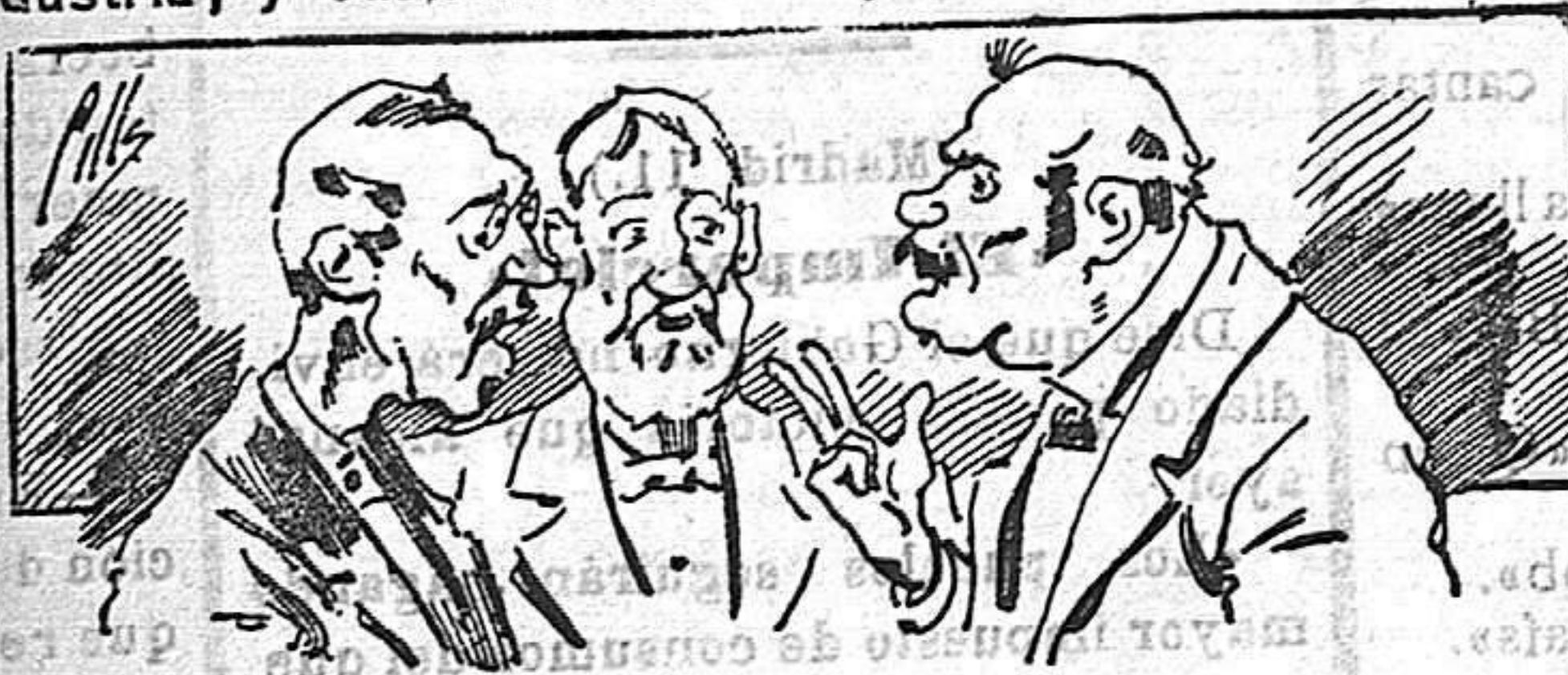
Abominan á nuestros libros..... pero los compran.

Todas las personas de gusto, curiosas é ilustradas deben pedir al Director de LA AVISPA, apartado núm. 8, MADRID, un ejemplar que se remite gratis y franqueado. Esta Revista Enciclopédica Popular publica recreaciones científicas, recetas de cocina, repostería, confitería, vinos, licores, pinturas, barnices, betunes y cuántas noticias y conocimientos puedan ser beneficiosos. Cuenta además con buenos grabados, parte literaria excelente; da regalos mensuales á sus lectores con la Lotería Nacional y participaciones en la misma, á cuyo efecto compra todos los sorteos, y en una de las Administraciones más afortunadas por la suerte, billetes enteros. La suscripción y los números que se nos pidan se sirven gratuitamente á correo vuelto y franqueados, con sólo indicar el nombre y dirección que lo desea en sobre dirigido al Sr. Administrador de