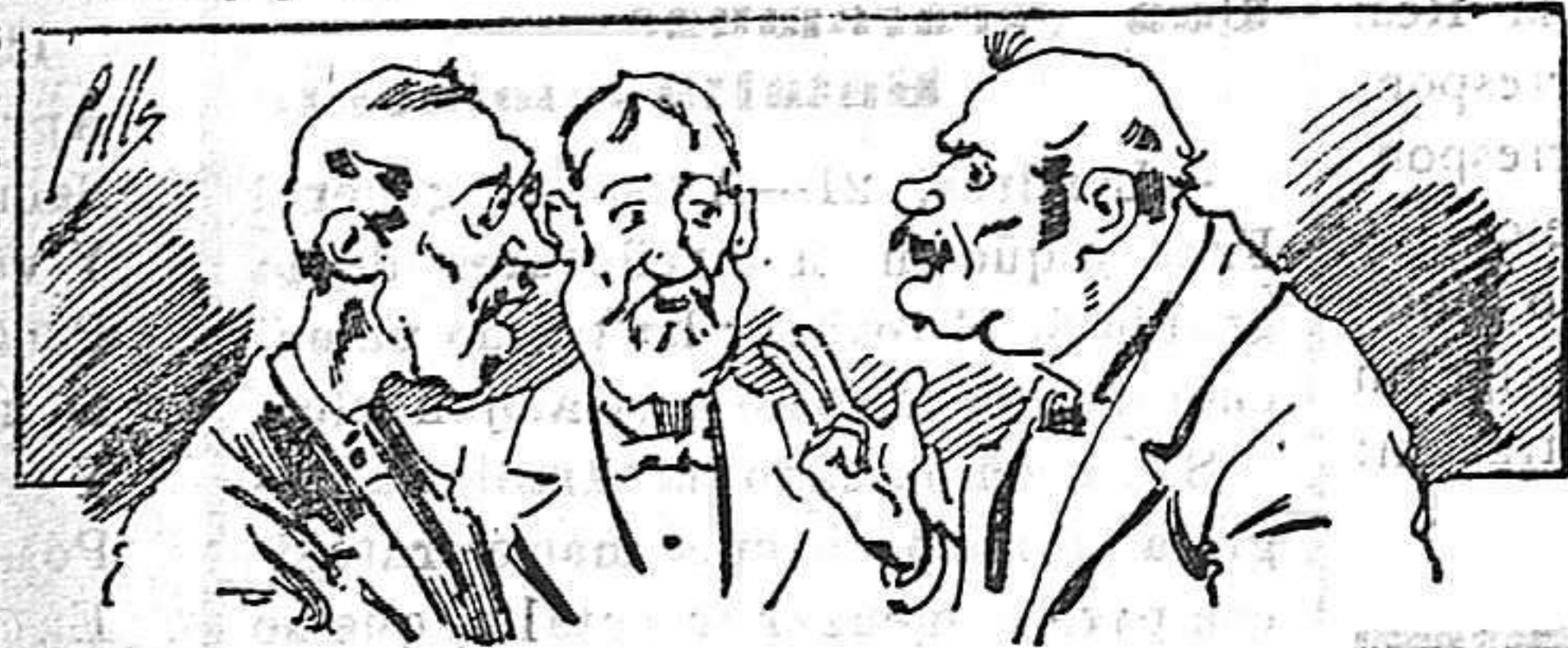
Abominan á nuestros libros....., pero los compran.

Todas las personas de gusto, curiosas é ilustradas deben pedir al Director de LA AVISPA, apartado núm. 8, MADRID, un ejemplar que se remite gratis y franqueado. Esta Revista Enciclopédica Popular publica recreaciones científicas, recetas de cocina, repostería, confitería, vinos, licores, pinturas, barnices, betunes y fórmulas para toda clase de industria, y cuantas noticias y conocimientos puedan ser beneficiosos. Cuenta además con buenos grabados, parte literaria excelente; da regalos mensuales á sus lectores con la Lotería Nacional y participaciones en la misma, á cuyo efecto compra todos los sorteos, y en una de las Administraciones más afortunadas por la suerte, billetes enteros. La suscripción y los números que se nos pidan se sirven gratuitamente á correo vuelto y franqueados, con sólo indicar el nombre y dirección del que lo desea en sobre dirigido al Sr. Administrador de