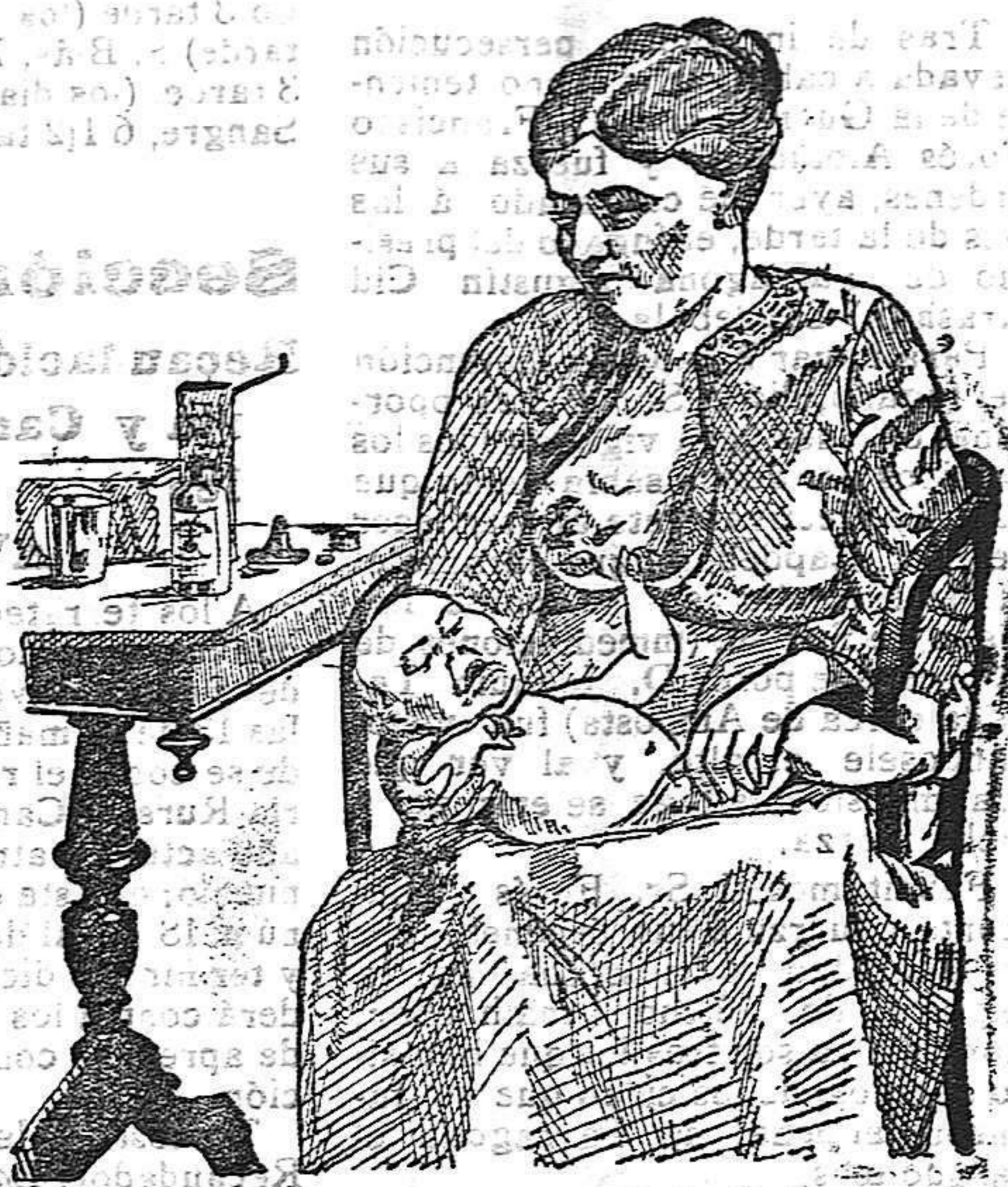
La que no hizo caso del Salverol