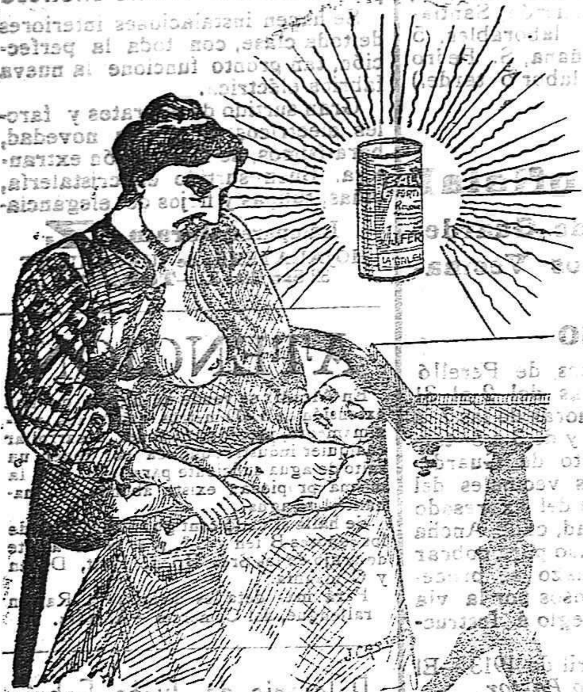
La que hizo caso del Salverol

Depósito general S. A. del Salverol en Santa Bárbara (Tarragona)