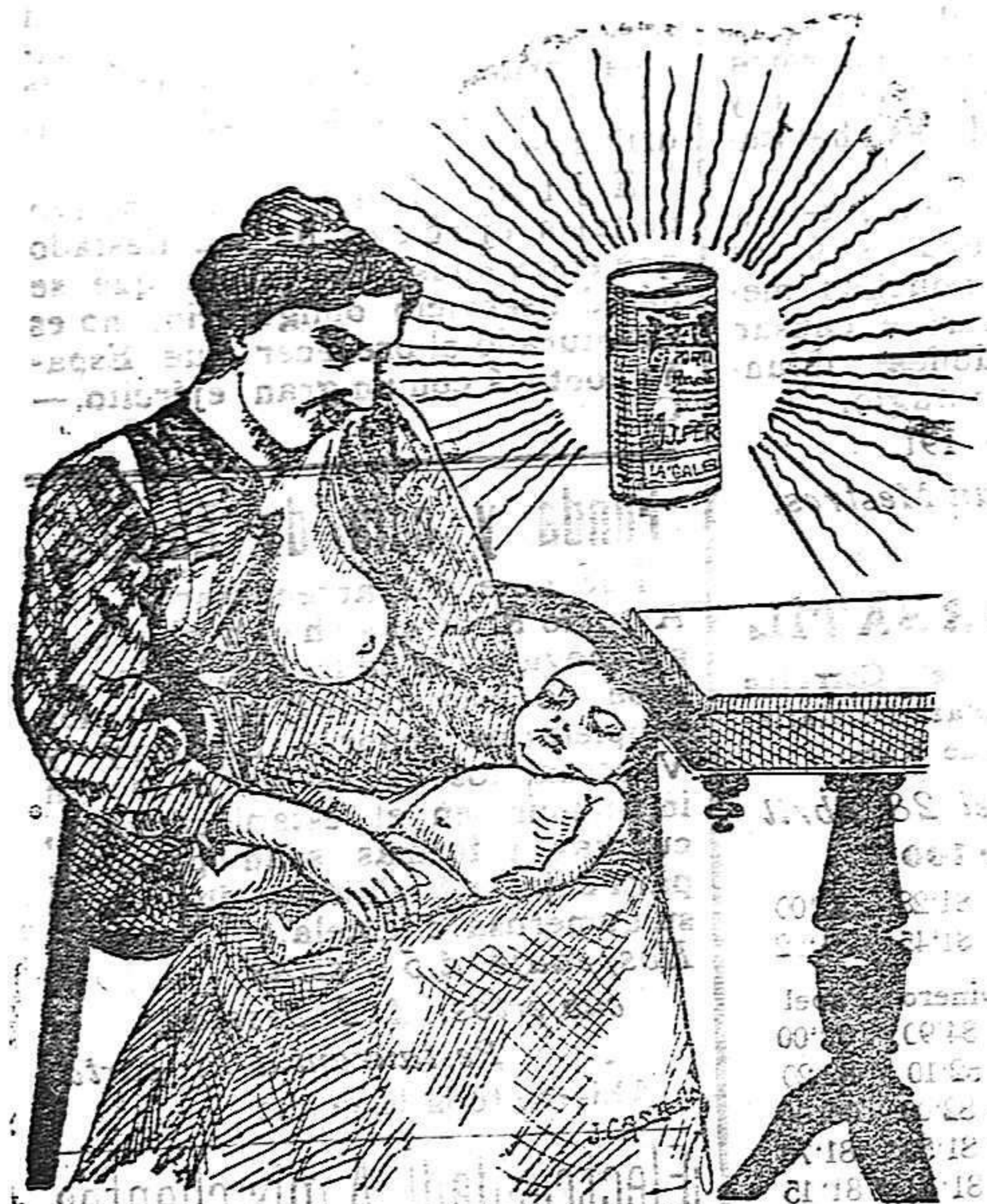
La que hizo caso del Salverol

Depósito general S. A. del Salverol en Santa Bárbara (Tarragona)