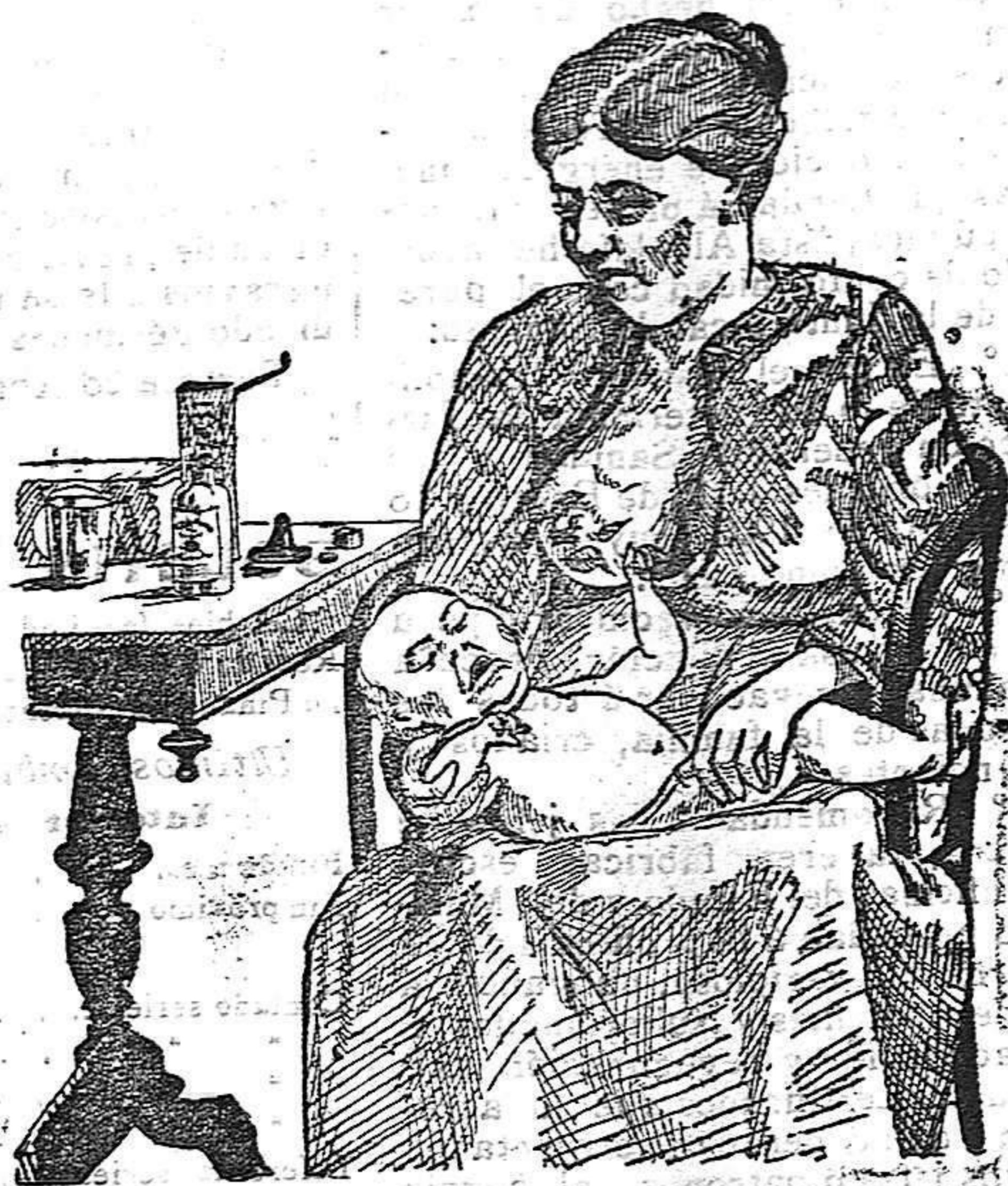
La que no hizo caso del Salverol