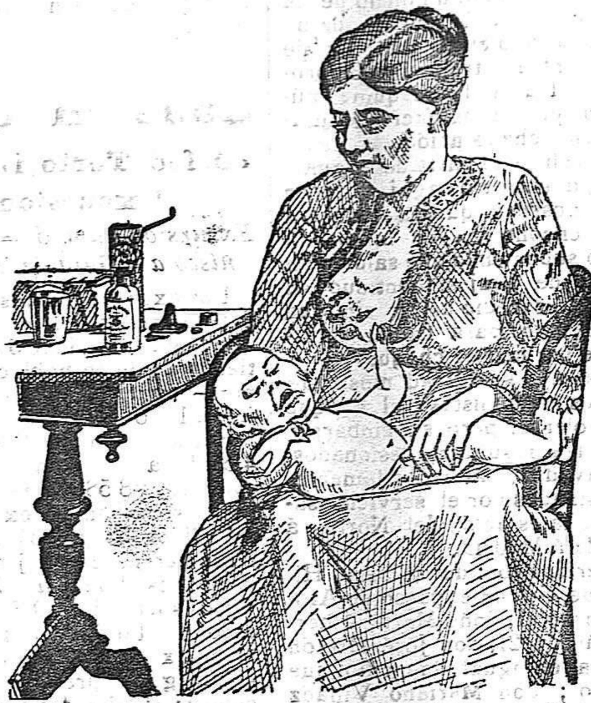
La que no hizo caso del Salverol