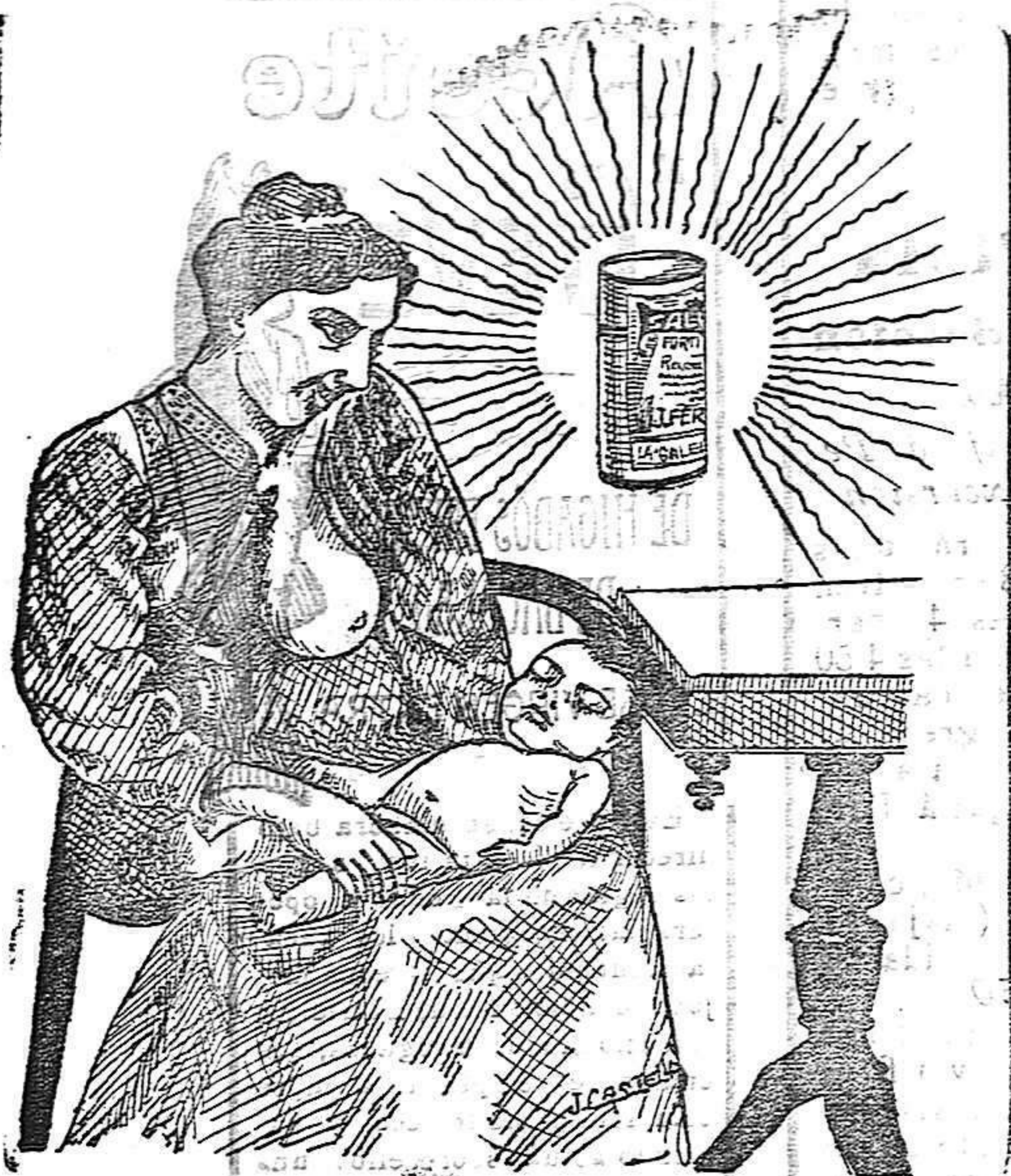
La que hizo caso del Salverol

Depósito general S. A. del Salverol en Santa Bárbara (Tarragona)