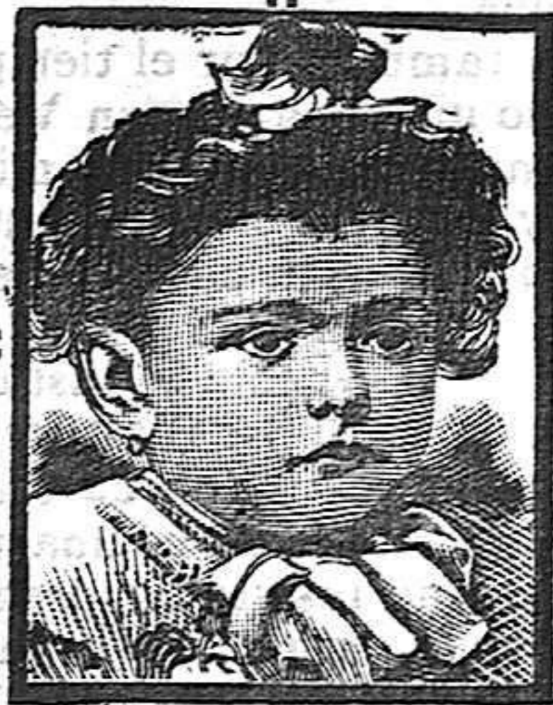
Barcelona, 22 Abril 1908.

sultan en su trabajo muy aliviados, y en cuanto al coste del arado no excede de lo que cuestan tres buenos arados de reja que, juntos apenas si hacen el trabajo de un solo arado de disco, lo cual equivale á la economía señalada en tiempo, hombres y ganado, aparte de la clase de labor.