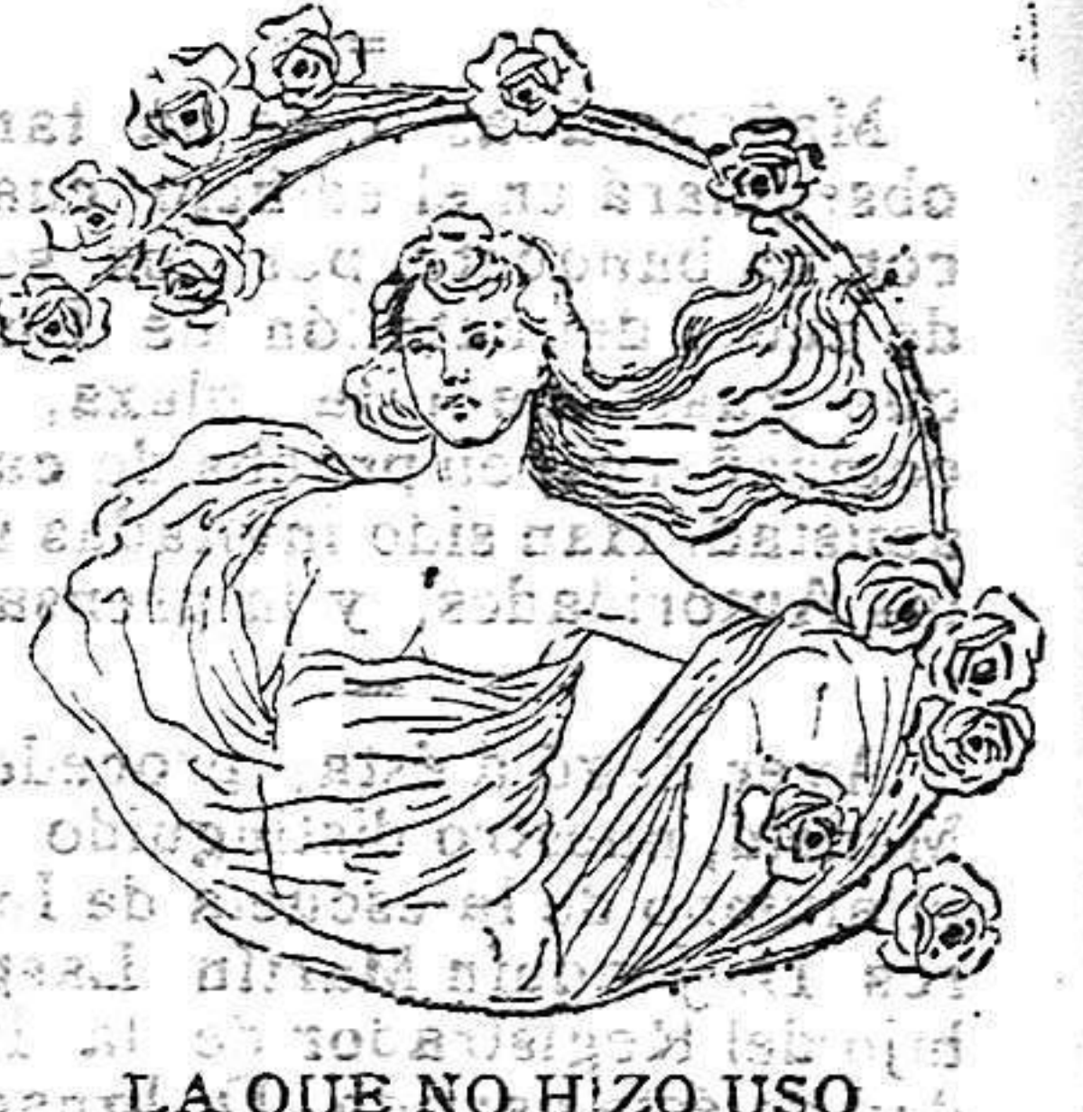
LA QUE NO HIZO USO DEL "SALVEROL"

NOTA PARA LAS SEÑORAS: En el caso de empezar tarde la aplicación, se podrán hacerse desde aplicaciones al día, 3 y 4, hasta que se hagan de 50 á 60 aplicaciones antes de parto.