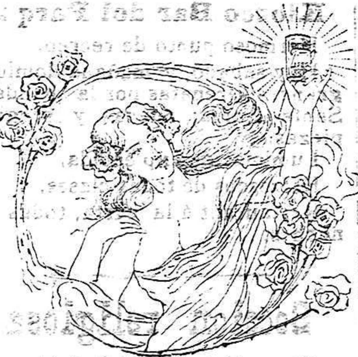
LA QUE HIZO USO DEL SALVEROL

A. Al entrar en el 8.º mes del embarazo, todas las mañanas se hará con una bayeta, un baño á los pechos con agua salada á saturación y á placer. Por espacio de 5 minutos, y enjuágaloos después con una tohalla. Se pondrá un grano de polvos al pulpejo de la mano y se resregará por toda la parte esponjosa y delantera de los pechos, hasta conseguir emocionarios en los poros del cutis, poniendo encima la misma bayeta, de dos dobles ligeramente mojada con la misma agua á placer y se abrochará el corsé.