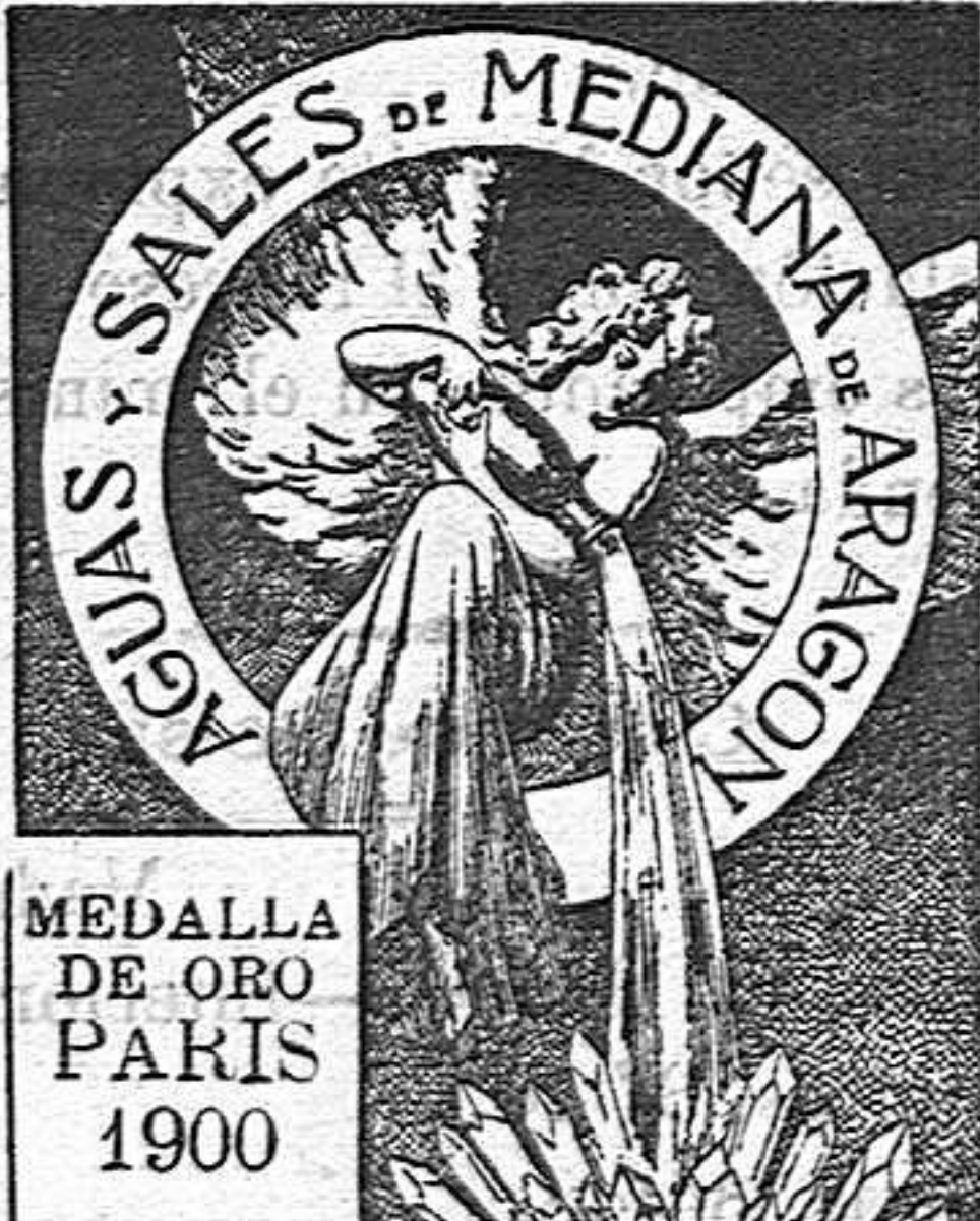
MEDALLA DE ORO PARIS 1900

Tomadas en Loción y Baño son eficacísimas y superiores á todo tratamiento para combatir el Herpetismo, Escarfulismo, Eczemas y todas las afecciones de la piel que tienen por origen la impureza de la sangre.