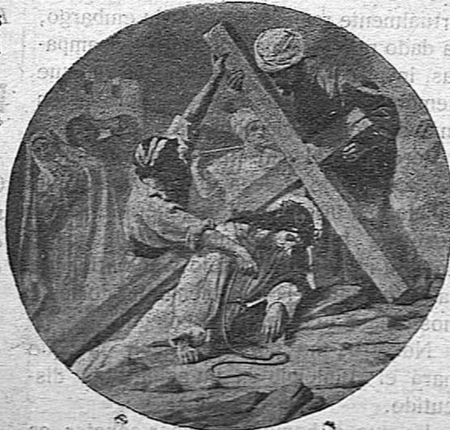
CAMINO DEL CALVARIO

Es lo triunfo de la fe la gloriosa resurrecció de Jesús. Y es lo triunfo de la esperansa pera natros que també ham de