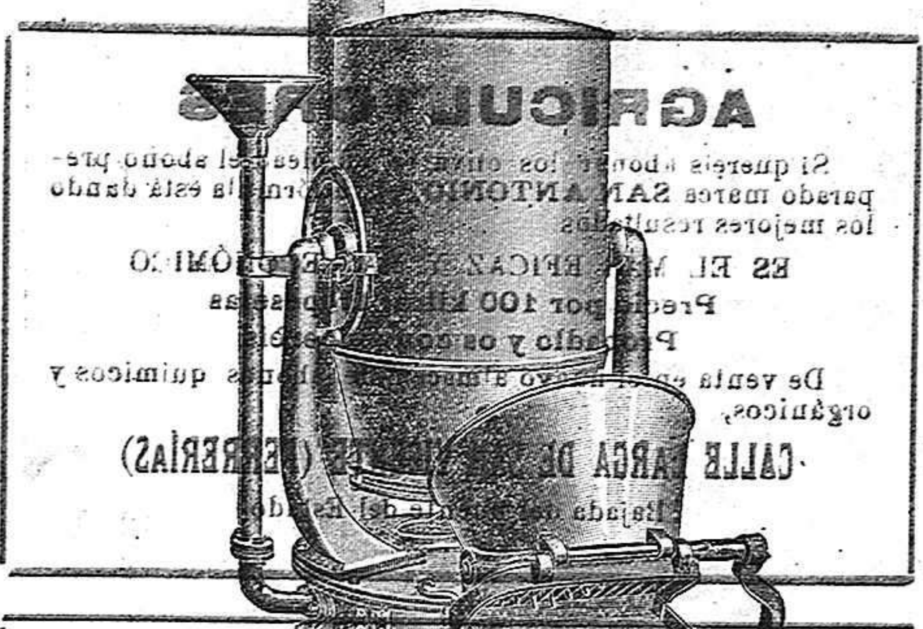
TATUJO OIOTPA Caldera para cocer los tubérculos, con triturador de las patatas (1).

Conservación de tomates. —Para conservar los tomates se toman estos bien maduros; se trituran con el triturador de la carne, y se extienden en un lienzo colocado sobre un esrejado metálico para que rescurra la parte de agua por dos ó tres cribas. Se hechan después los tomates en un jarro de barro cocido y bien vidriado, que contenga 1 gramo por litro de pasta de ácido salicílico y un poco de sal, que finalmente, cubrase la boca del jarro con 2 centímetros de aceite. Antes de usar esta conserva, se la deberá pasar por un colador para separar la corteza de las semillas.