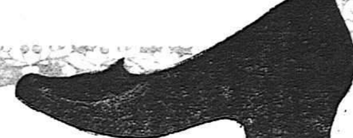
Señora, 5'50 pest.